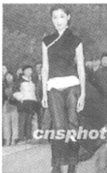
图 1 谭燕玉 2002 年首次中国内地时装展 Fig. 1 Vivienne Tam's debut in China mainland

作为调节或有黑色作为点缀,而上下部分分别采用不同的突出柔软手感的棉和表现飘逸质感的雪纺纱面料以打破黑色的沉闷.服装中采用右衽无袖的平面设计,这些显然是中国传统平面服装的元素,更能体现出东方式宽衣文化的内涵.为突出新意和变化,领口处的剪裁角度有所变化,使线条流畅,延伸至大襟处.止口和领口线处采用白色棉布滚边,这和黑色的棉质面料形成明度上的强烈对比.然而,黑白两种无彩色在面积上的巧妙对比又体现了中国古代传统道教和佛教的清静、无为的思想.这似乎和 2003 年春夏的普拉达(Prada)的中国风格的设计如出一辙,也许是因为同样对道教和佛教的宁静、淡泊、怡然的思想有所热衷所致.虽然旗袍元素的运用最能体现出中国精神,而谭燕玉却不执于此,和华裔设计师安娜·苏的后朋克和摇滚风格的东方情节一样,她以不拘一格的形式,将其对中国本土文化、艺术、传统等方面的理解和热爱用创新手法表现出来,创作出色彩鲜明的、使中国精神和现代意识共存的作品.如图 2、图 3 所示,一样是中国风格的 2004、2005 年秋冬发布会,面料上使用轻柔的丝绸、棉以及雪纺,颜色则多为清淡优雅的米黄和粉红,偶有加入一笔象征吉祥的被她广泛使用的朱红色作为点睛