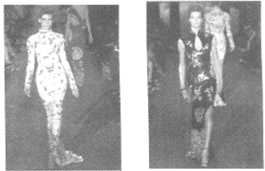
图6 汤姆·福特的2004年秋冬时装展