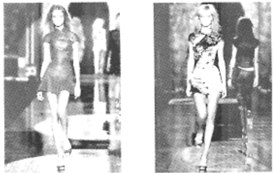
图5 罗伯特·卡瓦利2003年春夏时装展

Cavalli)在此季服装中借鉴中式风格来完善、充实他的这一路线.他采用中式旗袍的立领斜襟形制,进行了变化和裸露的设计,创作出紧身立体和突出腰部曲线的高腰设计的短裙或小上衣,或有飘逸的曳地长裙或紧身长裤和短裤.热情的鲜红色真丝和软皮面料上刺绣古铜色写实盘踞的龙纹,充满中国皇家味道的明黄面料印上或蓝或红的花鸟图案,颇为华丽的古铜色深浅层叠都是这次设计的亮点.此外,古驰(gucci)集团的创意总监汤姆·福特(tomford)的设计中体现了西方式窄衣文化精华,又带有独立的个性和极大的兼容与糅合能力,如图6所示.在卸任古驰之前为04/05年秋