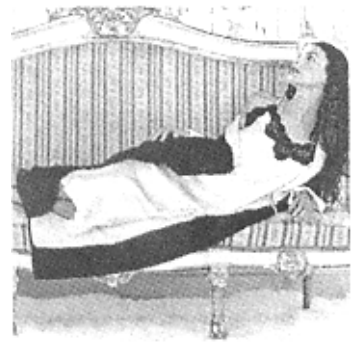
图8 与沙发风格十分相配的居家服装

的出现,就要求有新的居家服装来满足人们在这些新的活动中的着装需求.不管是哪一类服装的设计都离不开对那一时期人的研究.居家服装也是如此,需要不断地去研究现实中人的生活,了解他们在干什么、需要什么,这样才能使设计出来的服装有实用价值.就生活空间的变化来说,空调与取暖设备的普及使人们的居家着装在一定程度上摆脱了受气候影响的限制,即便是在冬天,穿上薄薄的羊毛织物的居家服装就足够了.此外,现代个性化的家庭装饰风格,必然要求与之风格相匹配的居家服装.在一个红木案几上安放笔砚,墙壁上悬挂着书画条幅的古色古香的家中,穿着中式居家服装才会有协调之感;而在一个安放着欧式古典家具的家中,丝绸面料的居家服装有足够的贵族气息与之相匹配,如图8所示.