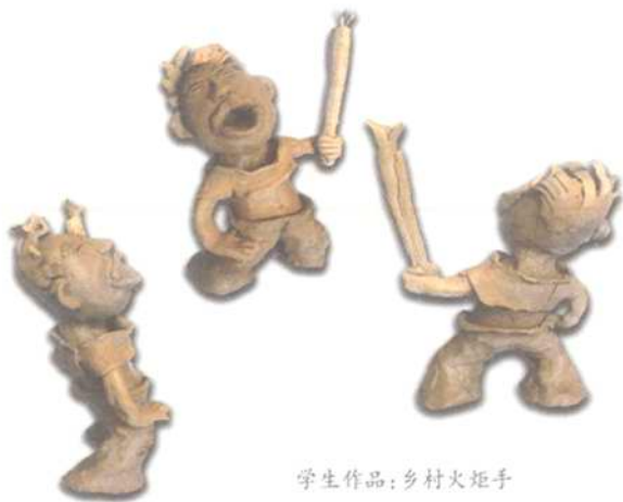
学生作品:乡村火炬手

我们在表现运动人物时,往往是人物的动态越舒展,姿态就越生动优美;而基于紫砂泥柔软的特性,它是很难在没有任何支撑的情况下达到这一效果的。创作中先确定“人物线架”的动态,然后再用紫砂泥通过泥塑的表现方法赋予人物肌肤和服饰,这样学生创作的运动人物就不会因为材料柔软而“东倒西歪”直不起腰、站不稳脚了。人物的运动姿态始终会跟着“人物动态线架”的姿态“走”,泥塑人物的动态会保持在相对稳