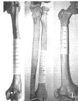
图 1 依次为肱骨、桡骨、股骨十模具型号(30、10、50 ml 注射器)

2.1 术前准备 无菌普通塑料注射器, 刀, 剪。适用范围: 超过 8 cm 瘤段缺损可用 2 副模具相接延长组合使用。尺寸选择: 肱骨、尺桡骨、股骨分别选 30、10、50 ml 注射器, 见图 1。 2.2 模具制作 第 1 副注射器: 截取带刻度的注射器体部, 去除注射器头部及尾部, 在注射器体部开槽, 剪除 1/4 管径, 作为管状模具主体。第 2 副注射器体部截取 1/2 管径作为管状模具筒盖, 在筒盖中央打孔作为骨水泥的注入孔, 可插入注入器头部, 第 3 副注射器作为骨水泥注入器。将第 2 副注射器盖上第 1 副注射器后, 形成管状模具, 重叠部分可防止骨水泥