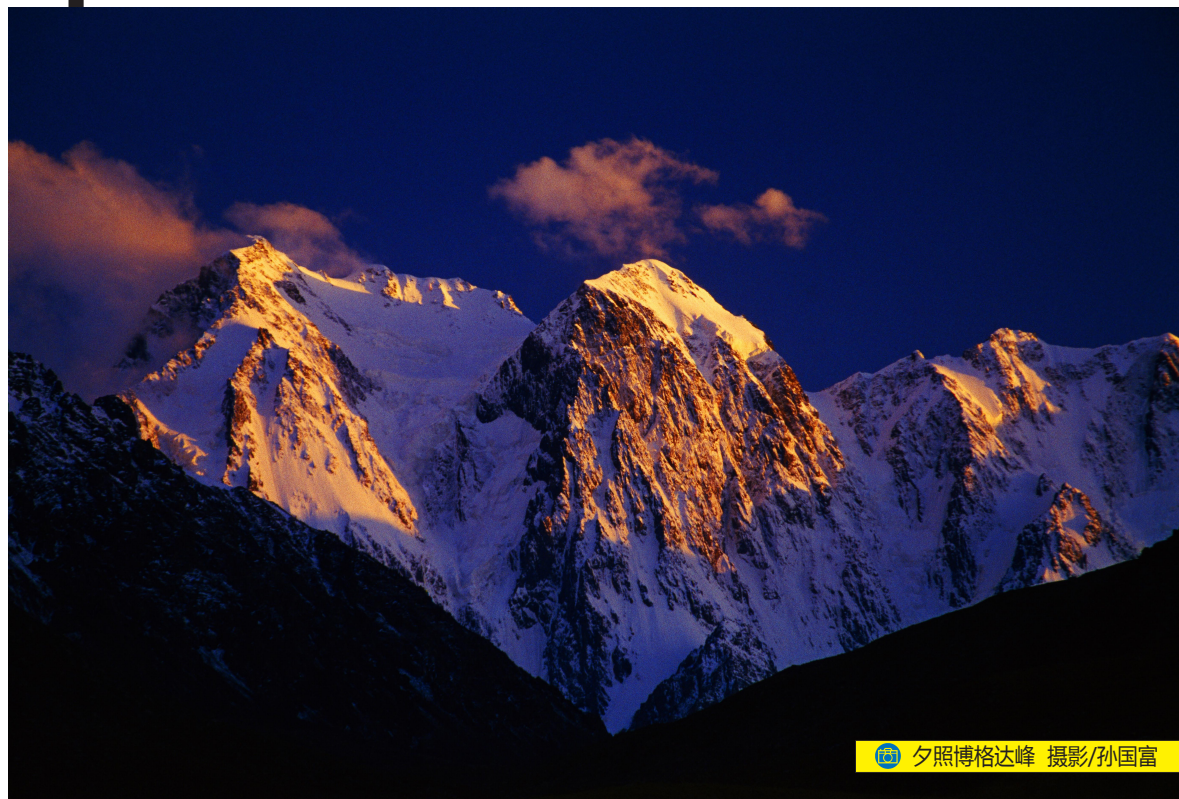
夕照博格达峰

走进这片土地，险峻的高山、辽阔的草原、神秘的戈壁瀚海、丰富的自然资源、淳朴的风土人情，将以其独特、粗犷、雄奇、博大的风采，引得无数游客流连忘返。