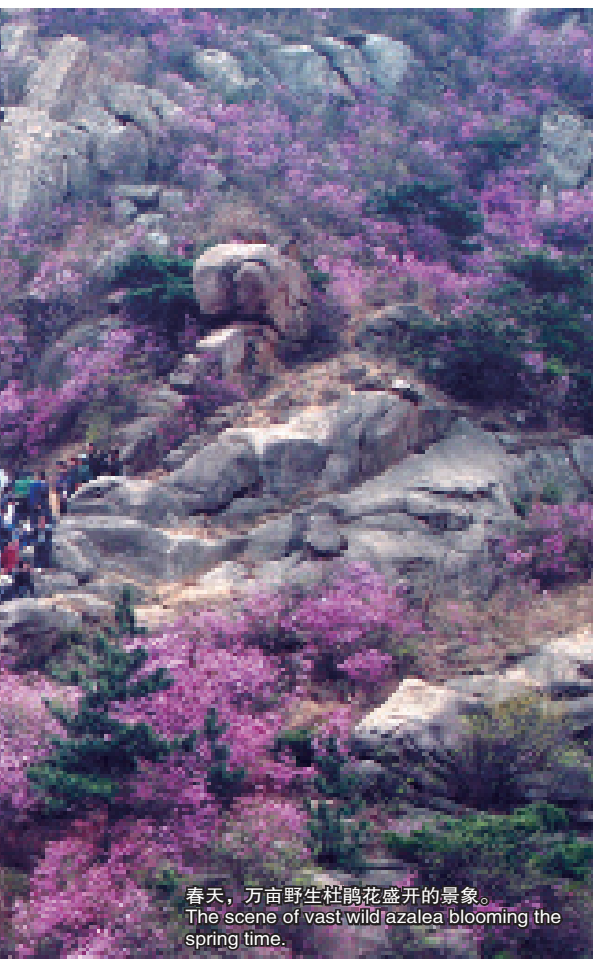
春天，万亩野生杜鹃花盛开的景象。 The scene of vast wild azalea blooming the spring time.

象棋残局等你来挑战；“花会美食坊”中，各地小吃、台湾美食及泰国、韩国等异国风味大荟萃。此外，今年杜鹃花会还设置了悬挂同心锁、与心形相框合影、悬挂五彩风铃、风铃现场制作、珠山庙会以及微信关注、“徒步穿越”达人评选、“我拍我秀”、“珠山印记”集章、“十载风采”图文分享等系列微旅游互动活动。值得一提的是，西海岸相关旅游景区景点、酒店等 20 多家旅游企业也联手开展“旅游一家亲”西海岸互动游活动，正式开启 2015 年黄岛春季旅游大幕。