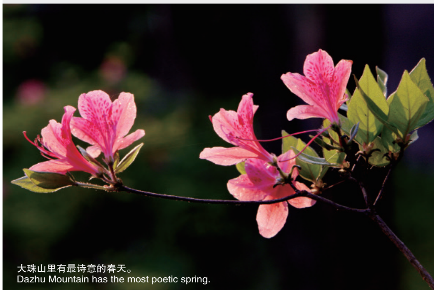
大珠山里有最诗意的春天。 Dazhu Mountain has the most poetic spring.