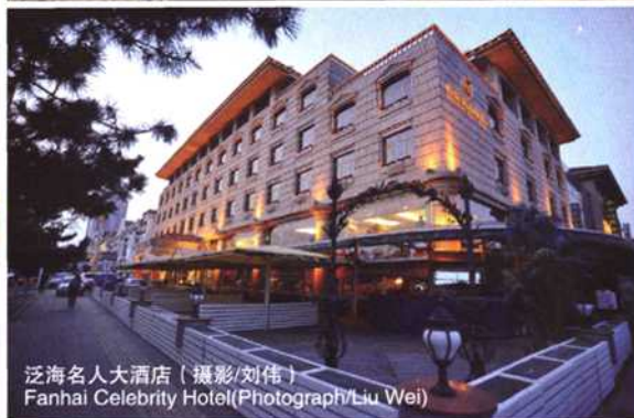
泛海名人大酒店 Fanhai Celebrity Hotel