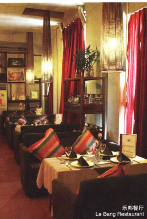
乐邦餐厅 Le Bang Restaurant

中联122创意广场，是时尚情侣的乐园，这里有最好的雪茄吧、红酒吧、最前卫的音乐、最纯粹的美食，众多“之最”里，最最吸引人的就是这里独有的空中酒吧和迷人夜景，这个季节最适合待在户外，如水凉夜，坐在宽广的户外平台上，欣赏城市的夜景，车流人流、霓虹幻影，酒不醉人人自醉……你会迷醉在市南之夜，爱上它。