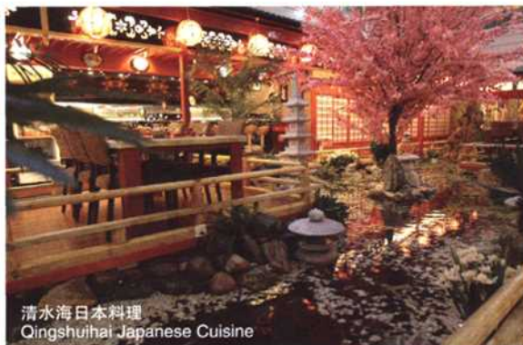
清水海日本料理 Qingshuihai Japanese Cuisine