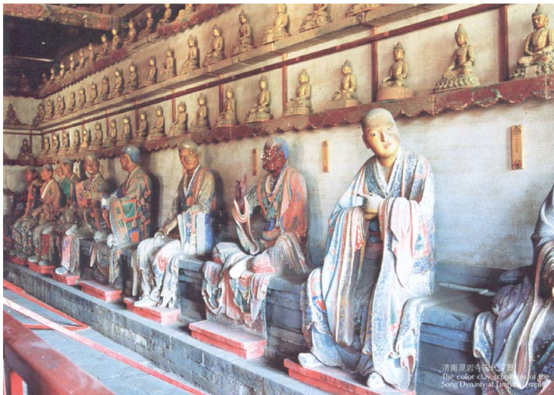
济南灵岩寺宋代彩塑 The color clay sculptures of the Song Dynasty at Lingyan Temple

戏文”，主要塑造戏曲人物。这类泥人很注意神态刻画，造型适当夸张，表现技法精练，色彩纯朴、深厚，实有江南地方特色。此外，山东高密、陕西凤翔、河北白沟、河南浚县、淮阳以及北京皆为泥塑艺术兴盛之地。