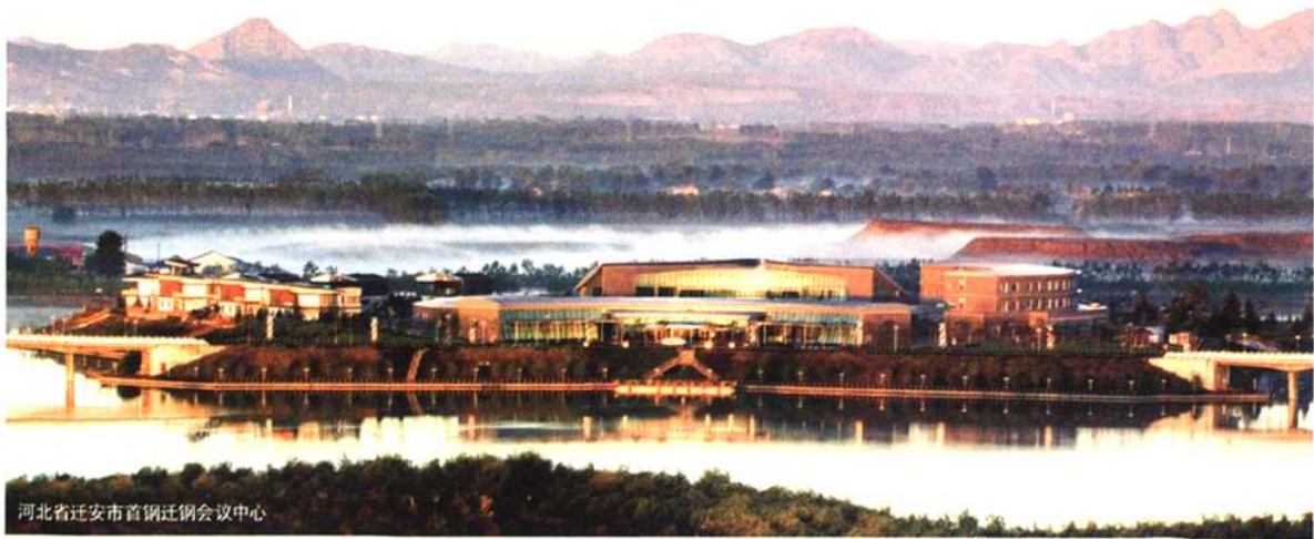
河北省迁安市首钢迁钢会议中心

优秀的首钢文化必将造就出更多优秀的首钢人，必将凝聚起更加强大的创新发展的力量。■