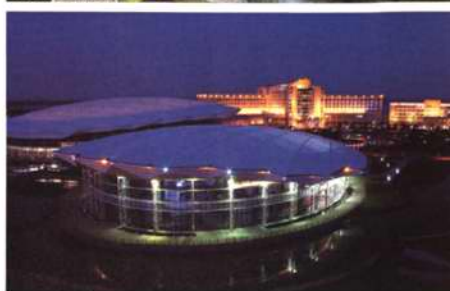
夜幕下的渤海国际会议中心

2010年发布的中国房地产企业综合实力排名中，首钢地产从2007年综合排名位列500强外，到2008年度综合实力位居第185，2009年度再次实现了新跨越，在全国8万多家房地产企业中位居第72。