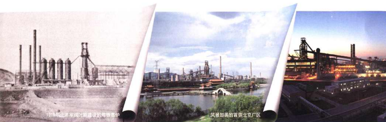
1919年北洋军阀时期建设的炼铁高炉