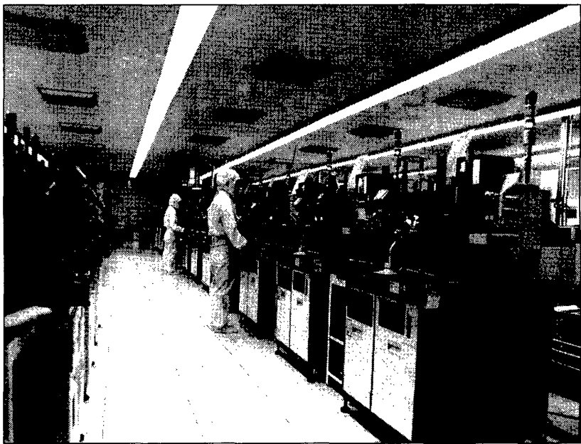
首钢日电电子有限公司大规模集成电路生产线

第二,用高新技术改造钢铁业、机械业和建筑业,实现传统产业技术升级和产品换代。用高新技术改造钢铁业,主要内容:一是压缩规模,从 800 万吨压缩到 600 万吨;二是淘汰落后,影响首都大气环境质量的工厂要停产、要搬迁,落后的设备要逐步淘汰;三是加大环境治理力度,实现钢铁生产清洁化;四是加大技术进步力度,实现钢铁产品精品化,建设线材、型材、中板、热轧薄板精品生产线;五是实施华北地区钢铁企业大