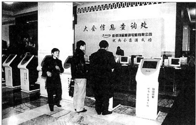
由首钢环星触摸电脑有限公司制造的触摸一体机为“两会”代表提供信息查询

企业的领导干部要真正代表广大职工的利益,必须给自己定好位。领导者的权力,是广大职工和党组织给予的,办一切事情,都要把党和人民的利益放在高于一切的位置,企业的利益、国家的利益、集体的利益,要高于个人利益。要自觉接受党组织和群众的监督,牢记全心全意为人民服务的宗旨,坚持共产党员的党性,把共产主义的远大理想和扎扎实实的工作结合起来,事事、时时从企业的改革发展,从广大职工的利益、国家的利益出发,处理好各种复杂的矛盾和问题。通过自己的身体力行,落实党风廉政建设的各项要求,做增强提高拒腐防变能力的表率。