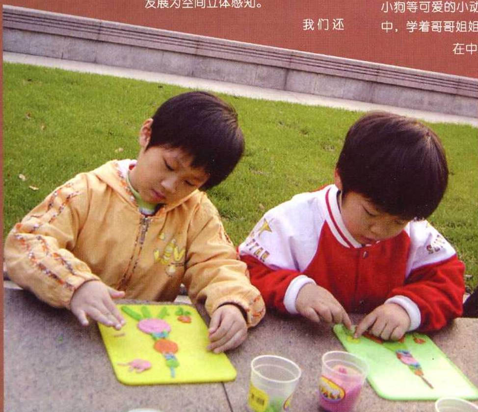
●崂山幼儿园 大一班幼儿在世纪大道上，捏塑马路上的建筑物

请家长参与幼儿的玩泥活动，和孩子共同体验玩泥的乐趣，亲眼看一看玩泥活动对孩子发展的作用。