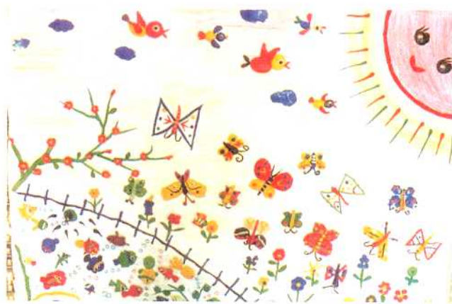
●《美丽的春天》（彩泥画）