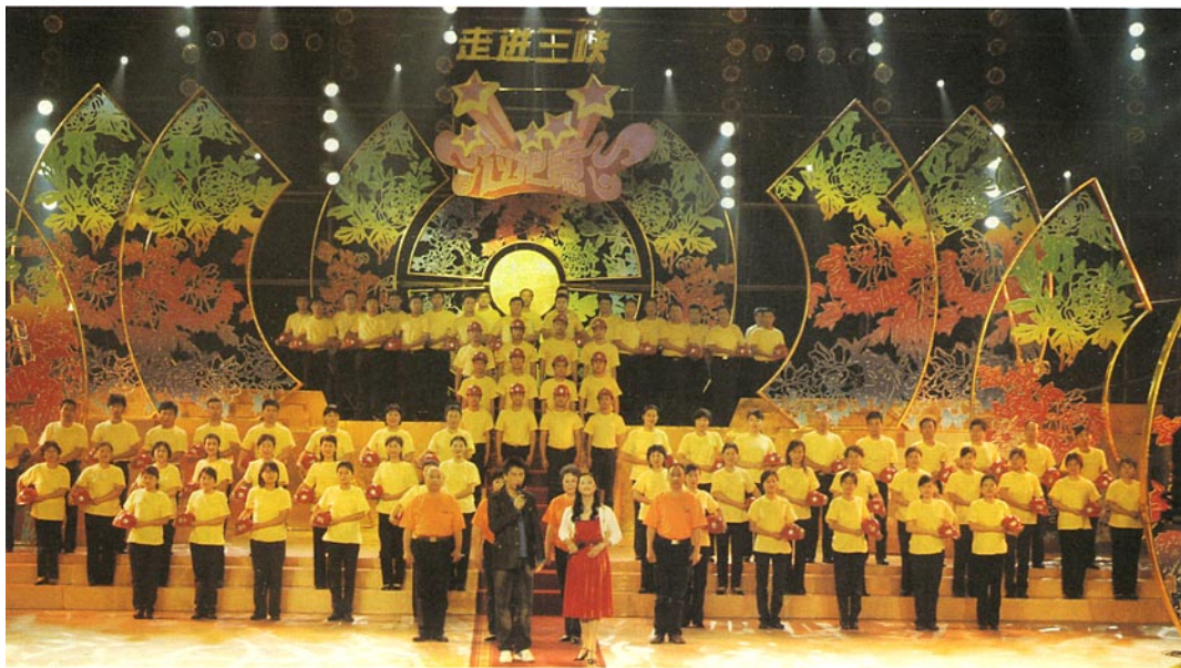
京剧联唱《三峡工人赞》拉开了央视《过把瘾》走进三峡戏曲晚会的序幕

起源于长江、汉水流域的京剧，因其优美的声腔、华丽的舞美及丰厚的文化底蕴，早已成为中华民族的国粹而闻名于世。或许是京剧与水，与大河存在着某种偶然或必然的联系，在闻名于当今世界的三峡枢纽工程建设工地，活跃着一支迷恋、痴情于京剧的票友群体。这一群体与闻名于世的三峡工程几乎同一天诞生，经过10余年的磨炼，已能像模像样地与国内著名京剧演员们同台“竞技”了。他们是一群普通的三峡建设者——中国三峡总公司的京剧票友。