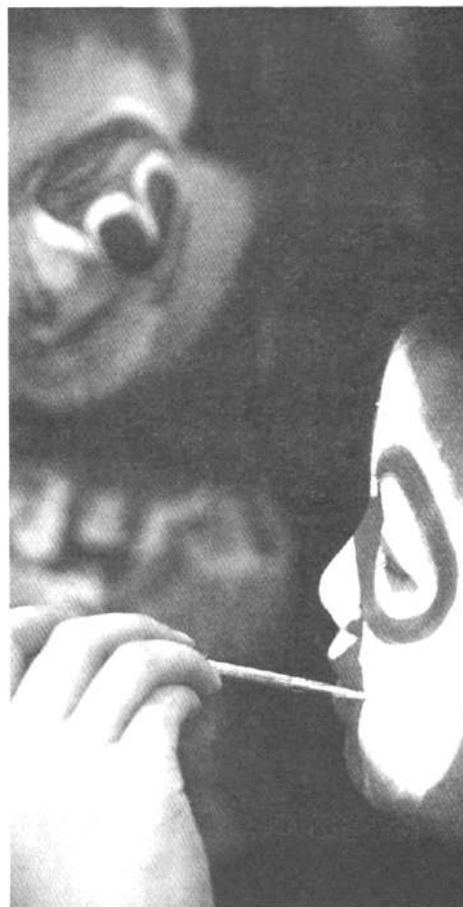
一笔笔勾描，画出张漂亮的脸谱