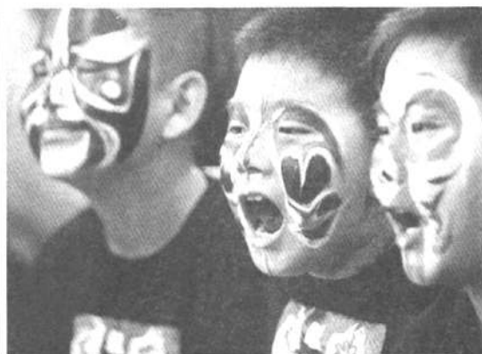
“演员”们在候场，等待精彩亮相