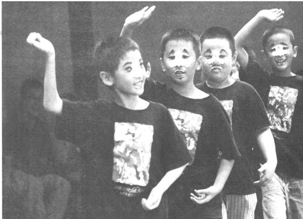
正在为演出做准备