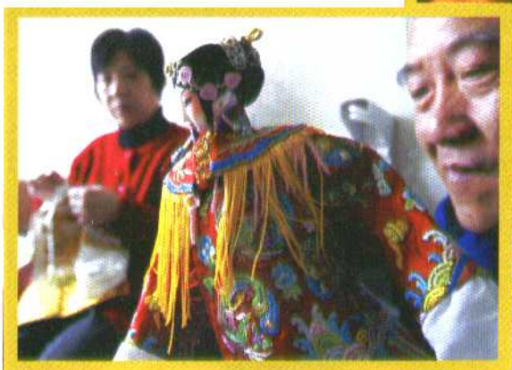
他在生、旦、净、末、丑的喜怒哀乐里雕刻着岁月流转