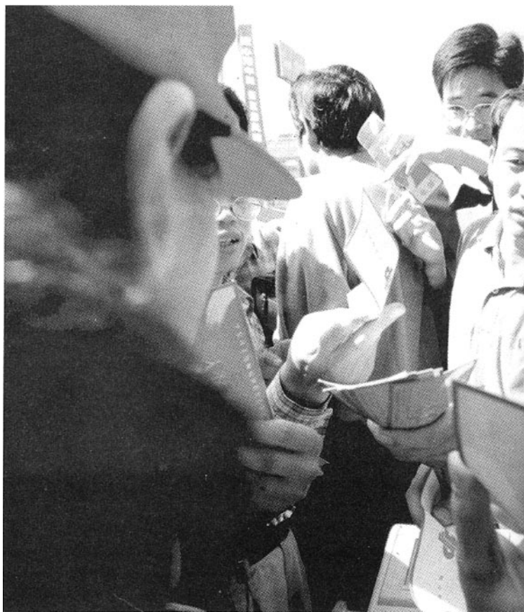
“2元+运气=500万的希望”这诱人的广告词令人心动

形式，一种就是在林州等地出现的电影彩票，另一种就是在济源出现的“诗谜博彩”。发行“私彩”，用不着多少投资，只需要印一些彩票，准备两个话筒及一个摇奖器即可。那个所谓的摇奖器其实也很简单，就是用铁丝围成一个圈，里面放入90个乒乓球，旁边有一个摇把，前面有一个通道，通过摇