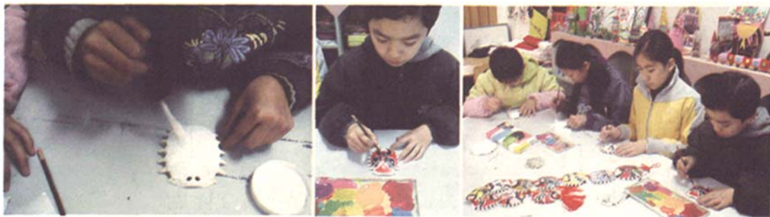
学生在制作京剧脸谱