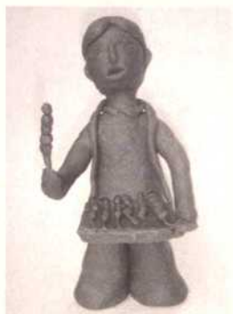
图 15《卖冰糖葫芦的人》