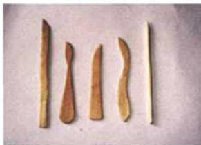
图 1 用小木条、棒冰棍自制泥刀