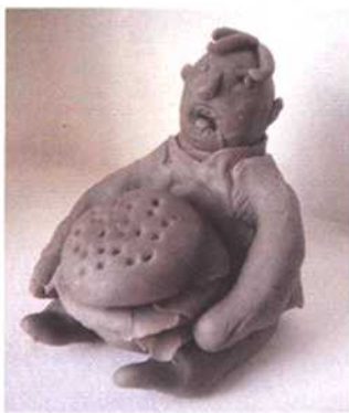
图 20《好大一个汉堡包》