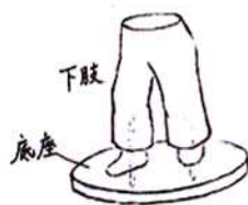
图11 利用底座加固重心

⑤注意事项:为了重心平稳,泥塑下部尽量整体表现,也可以做一个底座以增加底部重量。