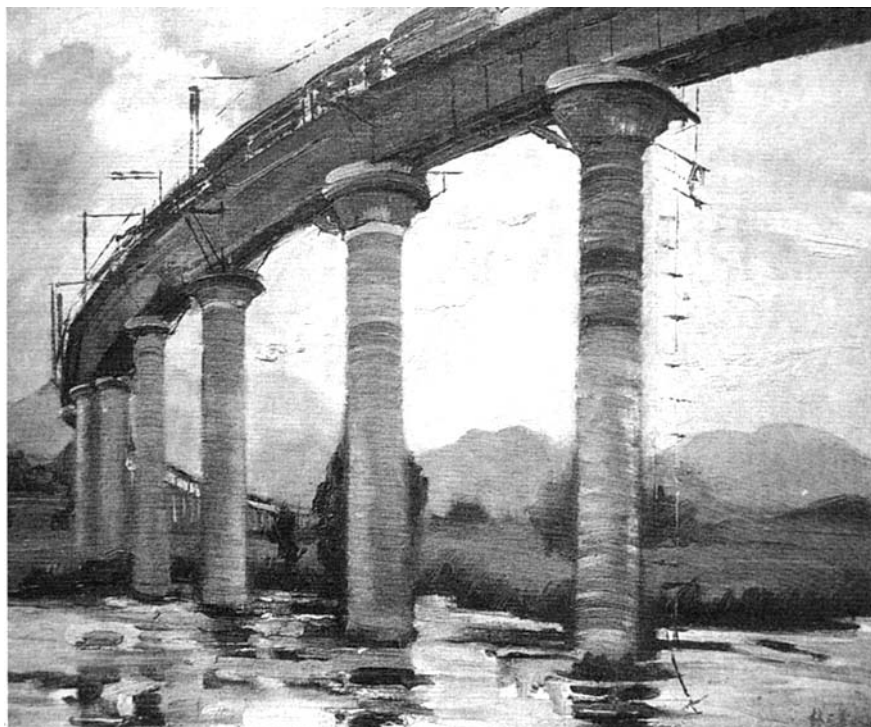
永定河上的铁路桥(油画)