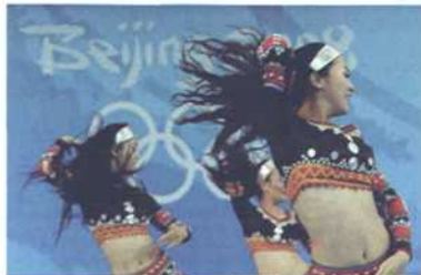
佤族风情的拉拉队