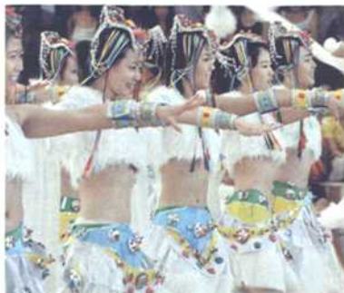
藏族风情的拉拉队