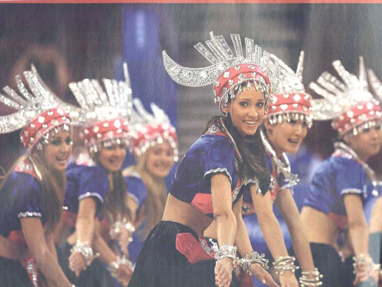
苗族风情的拉拉队