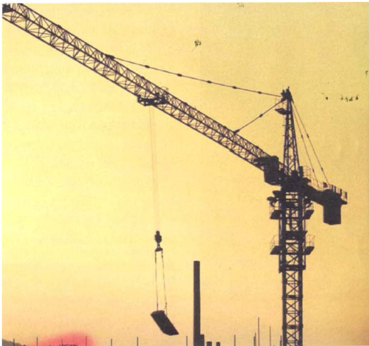
按照新修订的《北京城市总体规划（2004—2020）纲要》，西南五区积极贯彻落实科学发展观，近年来不断加大产业结构优化调整力度，积极引入发展新型高端产业。

首都发展的新形势下，加快西南五区发展，应立足《北京市城市总体规划（2004年—2020年）》，依据区域资源禀赋和现有产业可持续发展优势，以合作共赢为宗旨，创新发展模式，探索合作机制，加强区域之间的经济交流与合作，从完善各项基础设施和培育产业发展要素入手，统筹规划、协同发展，塑造独具特色的生态型西南产业组团，努力走出一条经济发展、生活富裕、生态良好的科学