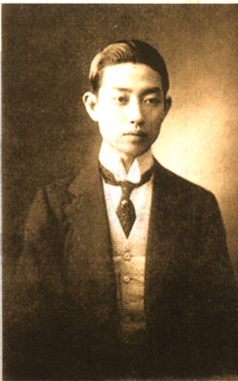
青年时期的梅兰芳。