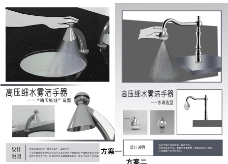
图2 “晴天娃娃”+“水滴造型”高压细水雾洁手器(方案一、二)

程中就已经浪费了很多水,所以水资源被浪费的问题是十分严重的。但若是以上公共场合能够装上细水雾洁手器的话,就能在很大程度上节约水资源。高压细水雾洁手器的设计仅是生态设计的分支上的一例。生态设计理念下的产品要解决或改善的问题还有很多。生态设计,任重道远。