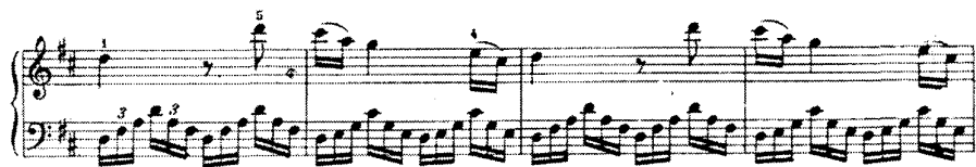
谱例(6)D大调钢琴奏鸣 (K576) 第三乐章

在D大调奏鸣曲三乐章的一开始，虽然这里的力度是（p），但Allegretto的速度掩饰不住他那轻松愉快的情绪。在后面左手符点音符的演奏中，有些演奏者往往因为速度快而将十六分符点音符演奏的节奏变形而使人听起来感觉像三连音。这种现象不止在这部作品中容易再现出来，在莫扎特其它的作品中也很容易出现。再者就是整体速度问题，快板乐章的十六分音符的三连音很容易使演奏者有一种向前冲的欲望，从而造成整个乐章中的速度不统一。莫扎特时期的作品形式还是一种非常对称的古典主义的形式，它只在谱面上有标记的地方有速度的变化，而不是在乐曲进行中有某些乐句会偏快偏慢。总体来说，演奏莫扎特的快板乐章的通病是演奏者往往会越弹越快，然后在乐句或乐曲的结尾时才慢下来。按照音乐的需要，在乐句或曲终做一些合理的渐慢是必要的，但赶拍子却是一种很不严谨的再现。在力度上的变化莫扎特的奏鸣曲如同比他稍早的海顿的作品一样，基本只有强（f）和弱（p）的变化。这种变化不是很夸张的，只是一个对比。海顿多为当时宫廷的达官贵人服务，在他的交响乐作品“惊愕”中突然出现的一个（f）力度的演奏就足以使某些贵夫人或小姐受到惊吓而尖叫，所以莫扎特的钢琴奏鸣曲中力度的变化并不是很过激的，但决不缺乏生气及动人的再现。他的音乐非常敏感、内在、深刻而丰富、外表含蓄而有节制。