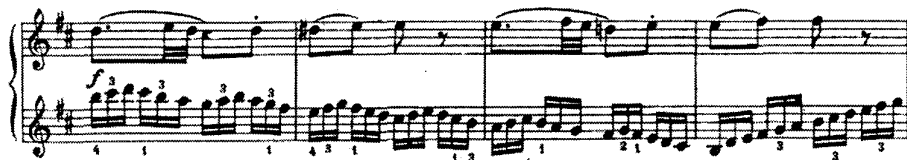
谱例(12)D大调钢琴奏鸣曲 (K576) 第三乐章

莫扎特的钢琴奏鸣曲从写作时间和地点可分为《萨尔茨堡奏鸣曲》，作品（K279～K284），属于早期创作的钢琴奏鸣曲，此时他的作品还缺乏统一的风格，思想感情也缺乏深度，但充满着乐观朝气的情绪。而作于曼海姆和慕尼黑的两首作品K309和K311已在艺术手法及风格上趋于成熟。1778年作于巴黎的五首奏鸣曲K310、K330、K331、K332、K333则已充分显现出他在艺术上的独特风格，在音乐形象上也非常丰富，再现出纯朴、内含、平静、柔美、热情而又积极向上的情绪在他的快板乐章上常出现如歌的旋律，这也是他此时作品风格的特点，此时他常倾向于创作如歌的快板。创作于1784年的《c小调奏鸣曲》是他在音乐感情上较为独特的一部作品，和声色彩以及调性的大胆应用在他的作品中非常少见。晚期的五首作品在他的创作历程已经非常成熟，高度的艺术性和精湛的艺术手法，使他达到艺术的顶峰，也给后人留下了享用不尽的瑰宝。