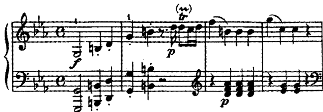
谱例(2)c小调钢琴奏鸣曲 (K457) 第一乐章

通过对谱例2的分析，我们发现真正的回答在这里，前一句的问题在这个乐段已得到了答案。从属七和弦到主和弦他已经给自己一个回答。但随着作品动机的发展，他内心焦躁的情绪又慢慢表现出来。（在1781年以后的几年中，莫扎特的作品中逐渐出现了多部小调作品，这在他一生的创作中很少见。这与1781年他从萨尔茨堡出来后开始了他动荡生活所受打击有很大关系。这在他的音乐中我们能清楚地感受到。）