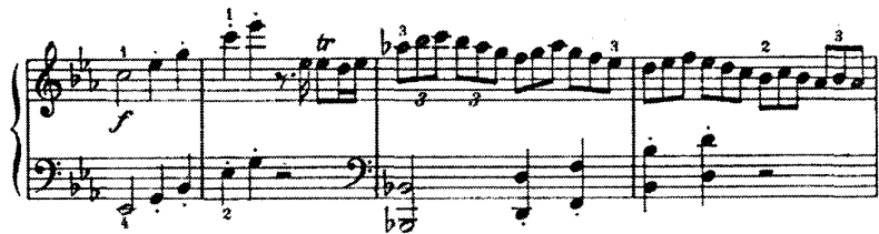
谱例(3)c小调钢琴奏鸣曲 (K457) 第一乐章

（这首奏鸣曲也有人把它和贝多芬的钢琴奏鸣曲“悲怆”相比，叫做莫扎特的“悲怆”奏鸣曲，大量三连奏织体的运用更恰当地表现出他内心的悲愤和烦躁不安。）