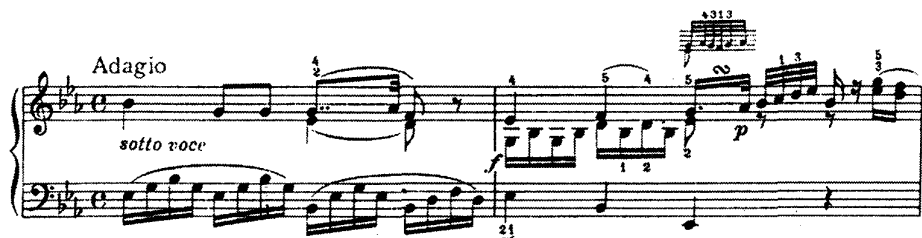
谱例(11)c小调钢琴奏鸣曲 (K457) 的第二乐章

轻快、活跃是莫扎特钢琴奏鸣曲第三乐章的主要特点，特别是他后期创作的几部钢琴奏鸣曲，第三乐章将他的欢快、活泼、富有活力而不失沉稳的音乐特点表现得淋漓尽致。尽管此时的莫扎特生活拮据，但他的坚定和自信使他敢于和封建贵族决裂，他的写作手法的日渐成熟使他作品越来越具有更高的艺术价值。