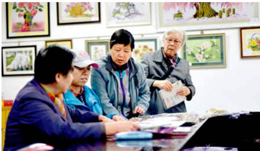
工美班在讨论设计图样。

“我们开设了14个这样的文体班队，除了书画、歌舞、京剧等传统班队外，还针对老同志的多样化需求，开设电脑、摄影、太极拳等课程。”处长介绍道。按照