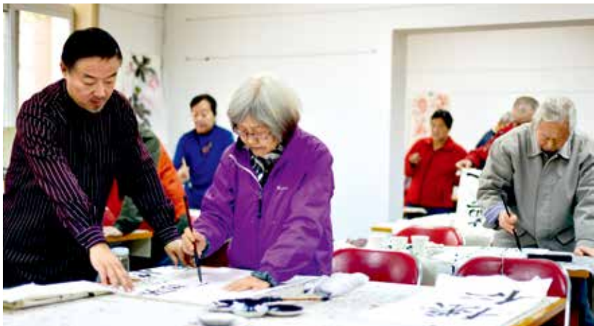
书法班上,大家认真练习。

但对老干部局来说,在组织方面最大的特点,还在于依靠老同志,建立了一支文体活动班队的骨干队伍。“我们一处只有4个人,人手有限,完全靠我们来组织管理是很难的。”处长说,为此,老干部局采取民主选举的方式,由班队学员自行推选组织能力强、身体比较好、有奉献精神的老干部为班队长。因为经常在一