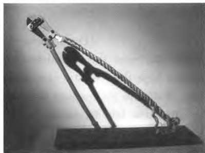
图5 阿斯卡·卡维力 物质之间

随着信息时代的到来和交通的发展,新疆的雕塑工作者能及时掌握国内外雕塑展信息,通过参加各类展览开阔了自己的视野。2004年,笔者创作的《五谷丰登》在上海青年美术展览中获得了二等奖,2005年创作的综合材料作品《物质之间》(图5)参加了上海首届国际城市雕塑双年展,并得到了国际策展人的赞扬。叶凡创作的《再次游中国》(图6)参加了多个展览获奖,并获得好评。