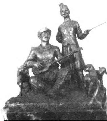
图3 苏帕洪·艾沙 金色阿勒泰 1965年

1960-1965年期间学习绘画专业,后因十分喜爱雕塑创作,随即师从席世荣先生学习人物泥塑塑造法。在庆祝新疆维吾尔自治区成立10周年之际,他以新疆少数民族生活为题材,以现实人物的生活场景为主要表达对象,创作的作品《金色阿勒泰》(图3),充满了对未来美满生活的渴望。