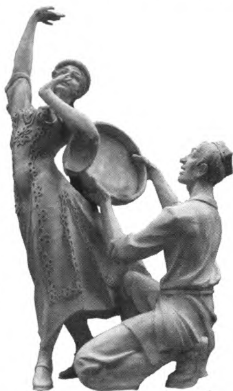
图4 地里木拉提·吐尔地 欢快的木卡姆

这一时期的创作思路比较单一,究其原因来说,第一,过分注重传统写实基础,影响了学生对现代雕塑艺术语言的学习和了解。第二,师资力量的严重缺乏。当时雕塑专业只有两人承担教学任务,虽然后来增加到四人,地里木拉提·吐尔地、李刚、叶凡、郭维阳,但不久之后,李刚老师因各种原因调离工作岗位。后来,原雕塑专业毕业的李永康留校并被分配到设计系,所以也很少担任雕塑专业课程。本身雕塑专业老师比较紧缺,有时还会被派往内地高校或国外学习深造,也是教学压力增加,无法丰富教学内容的原因之一。第三,信息的闭塞与交通不便利,无法及时掌握国内外雕塑行业信息,缺乏与雕塑界的业务交流。第四,新疆雕塑处于萌芽状态,可供师生参观的美术馆和博物馆的雕塑非常少,可以说几乎没有,师生只能通过