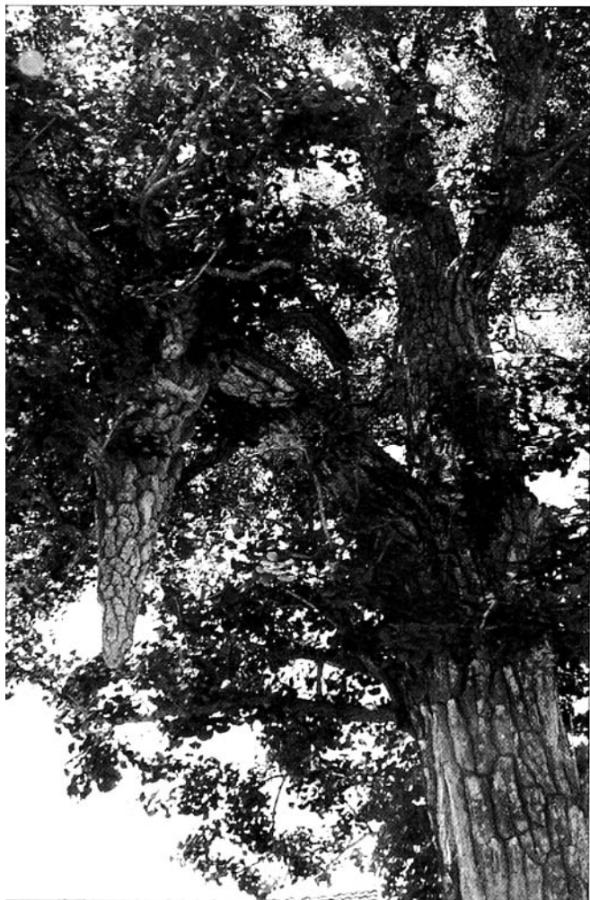
雌雄一体的银杏树

“树椎”，专家说南方有树长树椎最多20厘米长，而这个树椎有120厘米长，直径20多厘米，这是罕见之物。最奇的是树椎向上这一枝每年结果。据乡民介绍，当深秋来临，银杏树一片金黄，而结果这一枝却碧绿，所结白果小于其他地方的白果，并呈杏黄色，像葡萄一样成串挂在枝头。位于村北有一株千年古柏，胸径近2.5米，树冠平展，树杈横生，枝叶茂盛，宛如华盖，长势向东倾斜，远观又似灵芝，被当地人美称为“京西灵芝”。