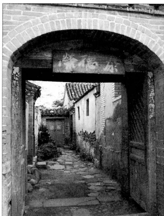
八大商号之一——荣德泰

产多而全。过去有两条古道从村边通过，一条通沿河城到河北矾山镇，一条通斋堂去清水到山西、内蒙古。因此，灵水在明清时期商业就逐渐发展起来了。村里有商号十余家，著名的有八家，号称八大商号。商业的兴盛还带动了手工业的发展，这里先后有杂面厂、铁铺、银匠铺、瓦窑、缸窑和香厂等手工作坊。