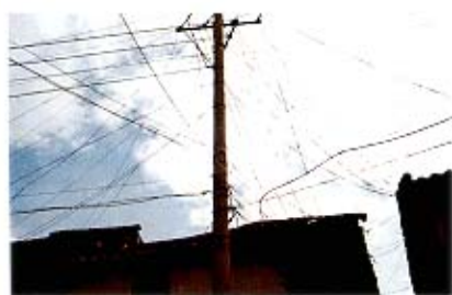
整治前的双廊镇“现代蜘蛛网”