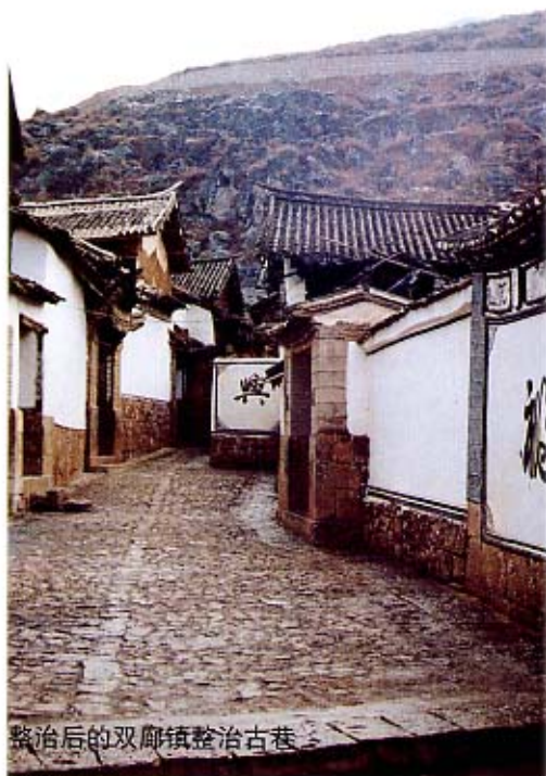
整治后的双廊镇整治古巷