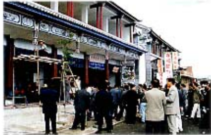
全州城镇建设工作现场会参观整治现场