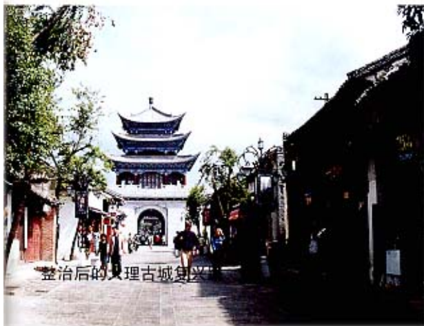
整治后的大理古城街景