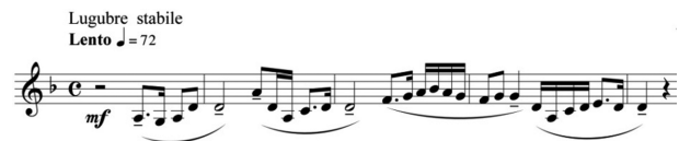
图2 于苏贤《赋格》主题

于苏贤《赋格》中的主题选取了李焕之创作的古琴弦歌合唱《苏武》中的部分音调作为主题旋律素材。这种将主题的部分音调直接从既有作品中抽取的方法,可以比较直观地反映出选材者的创作风格意趣和审美取向。为了体现钢琴曲音乐主题的音色标识性,作曲家还特别注重在乐曲的奏法设计方面体现古琴音乐的特点。例如,乐谱中为了体现古琴低音持续的特点而标记了保持音记号的音(图2)。作曲家要求在实际演奏中弹得稍重,曾提示:“赋格主题的基本风格特点是体现了古琴的韵味,主题中用重音记号的音,要弹出古琴按弦时的感觉。” [3] 可见,作曲家十分注重实际演奏中音色特性给予听者联想的指向性,使乐谱所标记的奏法能够尽量体现古琴奏法中起音和按弦的抑扬顿挫感。图2中《赋格》主题深沉、低徊音调的塑造也较好地挖掘了古琴音乐演奏所呈现出的音响特色,展现出古琴音乐元素在现代钢琴曲中的音色标识性。