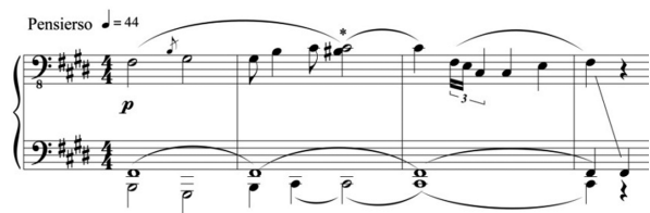
图1 汪立三《 \sharp F 商调:书法与琴韵》赋格主题

滑奏所产生的效果。3个声部在纵向上构成的纯五、纯八、纯四度的音程关系,音响空灵低徊,近似古琴多弦同弹手法所形成的自然协和音响。此外,以三连音的节奏形态实现对古琴“数弦多弹”奏法及节奏形态的模仿。三连音的节奏形态使旋律塑造呈现的更加自由,也更贴近古琴音乐自由随性的旋法特点。这些富有古琴音乐特色的音乐语汇在赋格段主题呈现中频繁出现,在凸显出主题旋律舒缓低沉特点的同时,也通过拖拽和颤吟而挖掘其修饰感较强的音色特性。