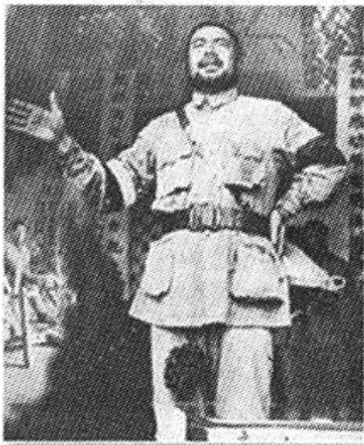
▲冯玉祥向部队训话。

自1920年第十六混成旅改编为陆军第十一师以后，冯玉祥领导的这一不断接受革命和进步思潮影响的军事团体，虽说名义上仍隶属于直系，实际上已逐步形成一支相对独立的军事力量。1922年直奉战争爆发。4月19日，冯军奉命向洛阳集中。当直军在长辛店一带战事吃紧时，冯立派李鸣钟率第二十一旅增援，自己则率军大败河南督军赵倜。至此，直系进一步控制了北京政府，冯玉祥也因战功被任为河南督军。当年5月，冯颁布了《治豫大纲》，宣布严惩贪官，提倡节俭，改良市风，重视教育，发展交通等。正当冯大展治豫宏图之际，却遭到直系