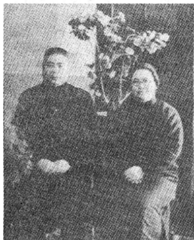
▲冯玉祥与夫人李德全(1947年)

是一轮赤日烧空，大地江河断流，湖塘干涸。面对旱魃为虐，北洋政府的头目们一个个都束手无策。贿选总统曹锟为了显示其体恤民瘼，宣称浴身斋居，戒杀三日，以效“成汤桑林之祷”；山西都督阎锡山也不甘人后，亲执铁牌，