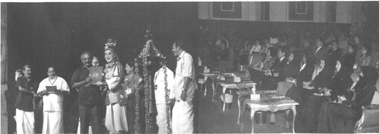
浙京在印度演出《宝莲灯》