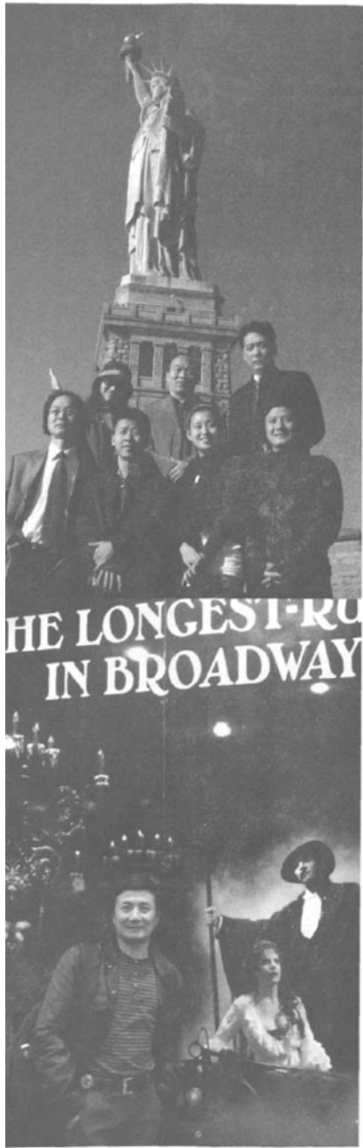
上图：浙京实验京剧《王者俄狄》剧组（2010年）出访美国

（三）中西交融的跨文化戏剧深化了京剧对外交流的内在共鸣。和京剧长久以来以表演艺术为核心的对外交流有所不同，实验京剧《王者