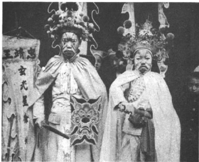
这两位披白袍和持剑，气势汹汹，身边还有“忠靖王”的旗帜。

这些演员对于自己所扮演的角色似乎并没有什么清楚的概念。我问其中的一些演员，他们游神队伍中所供奉的那个鬼究竟是谁，他们都摇头说不知道。根据其中一个画着大花脸，但笑容可掬的“鬼”的说法，这个游神仪式是为了纪念一位舍身救人的当地英雄，他知道有一口井里的水下了毒，但是又无法说服那些要把井水挑到城里各家去的挑水夫们，所以便投井自杀，以防止更大的悲剧发生。除了这个游神仪式之外，一年中还有另外几个节日，中国人也会抬着一些偶像游行。当地中国人会告诉你，他们所尊崇的是一个“鬼”，即精怪。游神仪式所尊崇的几乎总是一个恶鬼，而人们的尊崇形式就是想要抚慰它，无论它是河神、火神，或任何其他某一个鬼，而后者毫无例外地想要向可怜的不幸人们复仇，不管是根据真实或想象出来的理由。 [2]