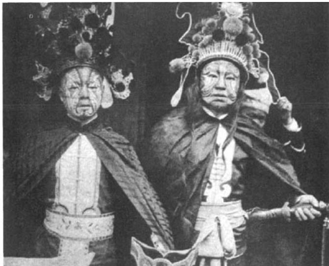
这两位披斗篷佩剑的显然是鬼王身边的骁将。