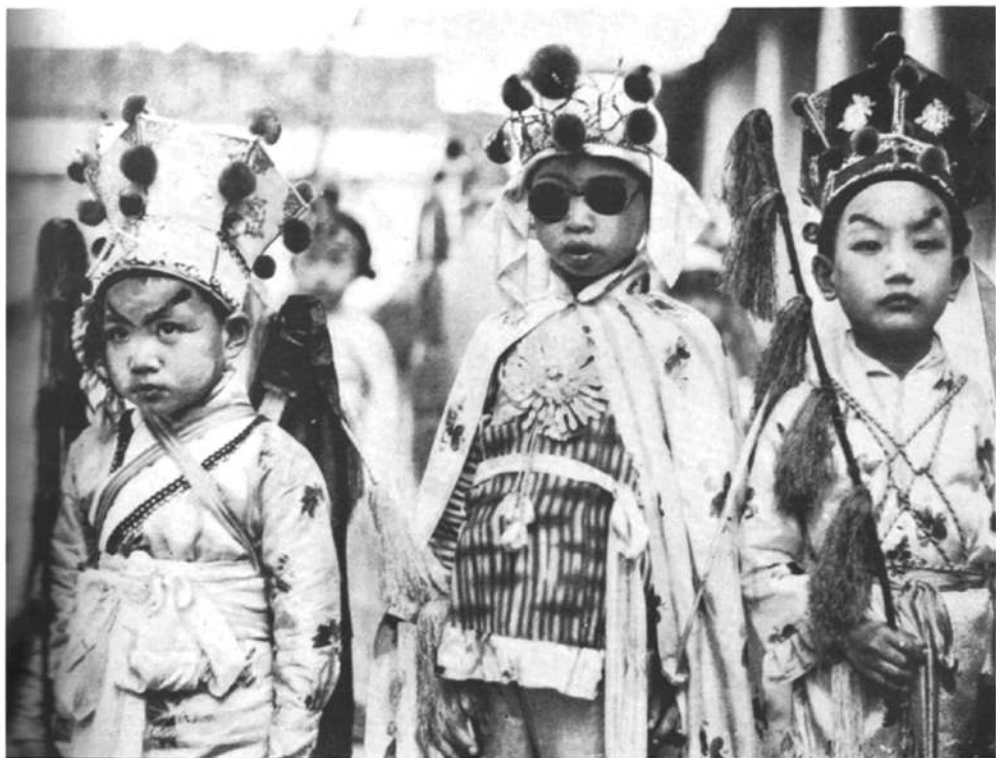
□还有另外三个整装待发的小鬼