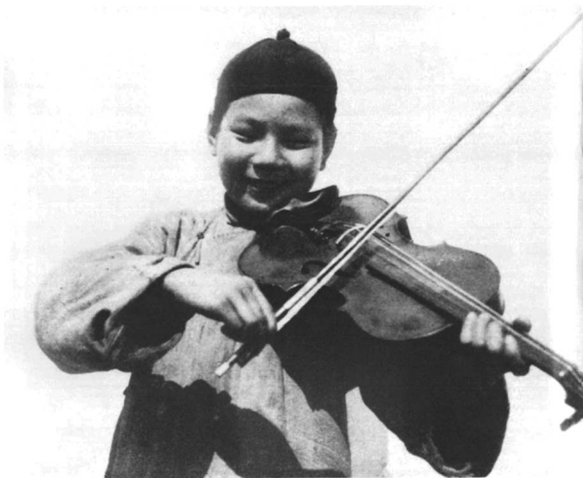
□一位拉小提琴的丽水小男孩