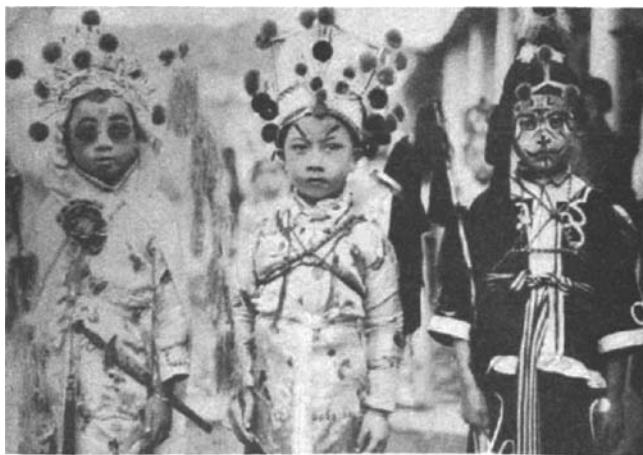
三个稚气未褪的小鬼