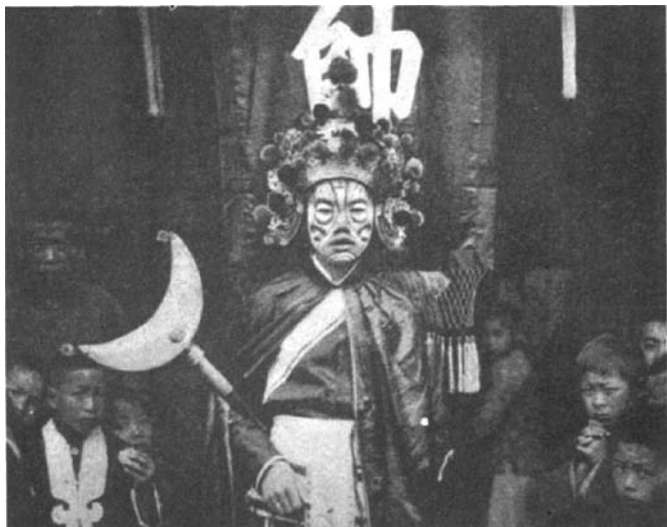
这位站在“帅”旗前的人显然是扮演鬼魅们的首领。

平淡无奇的行当里，有的是白铁匠，有的是裁缝，还有的是挑夫。我们让那位无所不知的“下人”去执行核对照片中人的任务，由他负责让每位演员拿到自己的照片。每个人在看到自己扮鬼的照片时都哈哈大笑，并互相大声开着玩笑。但是他们对于洋人恪守信用一事都感到满意，你可以看到书中这些插图的原照片挂在丽水很多人家的家里或手工作坊里。今年，当我们对于给游神仪式拍照一事不再感兴趣的时候，游神的队伍又在我们传教使团的驻地前停了下来，那些孩子们为了想要再次获得桔子、糖果和瓜子的招待，纷纷涌入了我们的住房。他们似乎认为，访问天主教传教使团是这个每年一次游神仪式的正式项目之一。