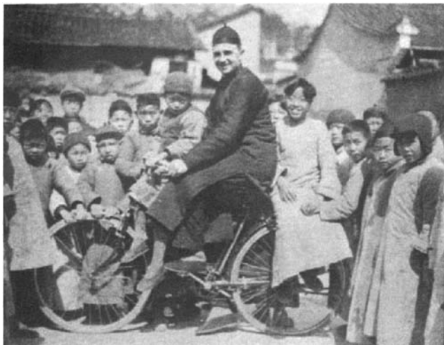
加拿大天主教传教士跟丽水当地儿童们的关系相当不错。

到的却是一支颇有地方特色、犄角上扎着红绸的牛队。还有温州巡游队伍中的第二站中都是穿黑衣戴高帽的人，而丽水的皂隶会成员却穿着“蓝色镶白边的直襟短衫”。丽水三月三太保庙会中的高跷队在温州的巡游队伍中并没有出现，而其坐在小轿子里的那些由小孩子扮演的天官天将跟温州巡游队伍中走路的文武判官、值殿将军和太监们相比，似乎也有较大的差别。