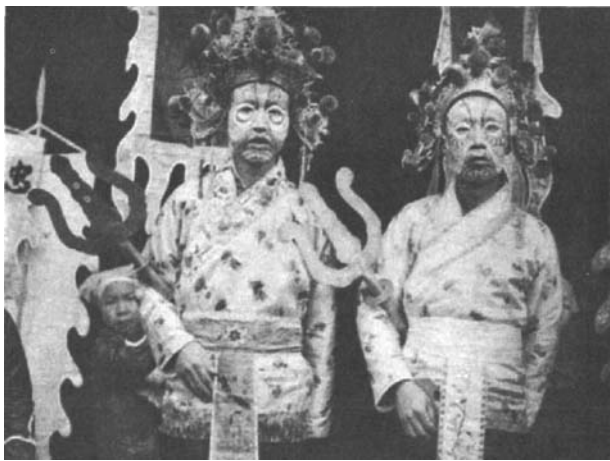
两位化妆完毕,准备扮演鬼魅的成年男子

因此,我们就派他到负责游神的总部去寻求拍照的准许。对方回话说,他们不允许我们去拍照。这事似乎就这么过去了。然而过了几天之后,就在举行大型游神仪式的前一天,我们被告知,假如我们能够给每位参加游神演出的人提供一张12×16英寸的大照片,即城里照相馆拍的那种同样大小的照片,我们就可以被允许去拍照。扮演鬼神的人大约有五十个,所以这个提议似乎价格过于昂贵。我们以中国人的方式讨价还价,提出给每位演员提供一张用我的照相机拍摄的4×5英寸大小的照片,但是对方不肯答应。他们坚持想要那种大照片,然而,我们了解那些中国人的处事方式,所以并没有完全失去希望。