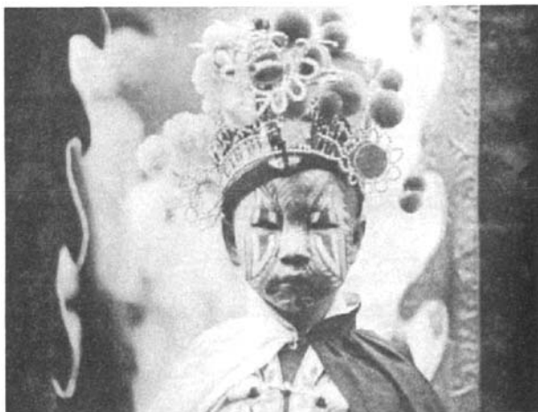
一个画好了小鬼脸谱，准备参加游神活动的小孩