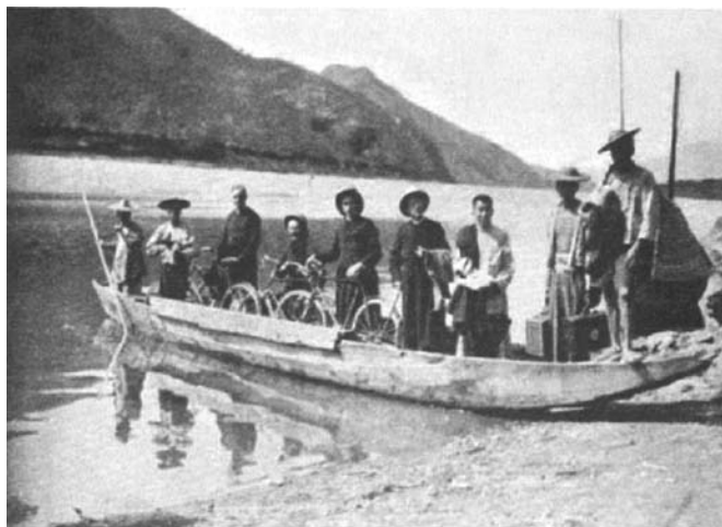
丽水当地的摆渡船

三月初三这天，附近乡村的人都纷纷赶到城里观赏一年一度的“太保庙会”，有些较远的乡村民众，还翻山越岭于初二挑些土产到城里投亲靠友住宿一夜，把土产给些亲友，大部分于次日上市出售，因为丽水的市集日是每个农历月的逢三逢八，三月初三正好也是市日，是日既可赶市售货购物，又可观赏盛大的庙会，确是一举多得的乐事。