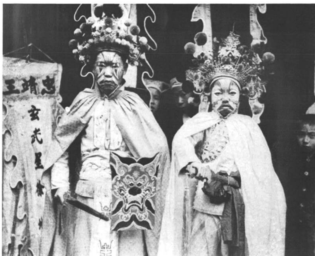
□这两位也披白袍和持剑，气势汹汹，身边还有“忠靖王”的旗帜。