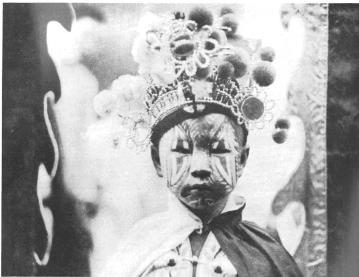
□一位画好了小鬼脸谱，准备参加游神活动的小孩。