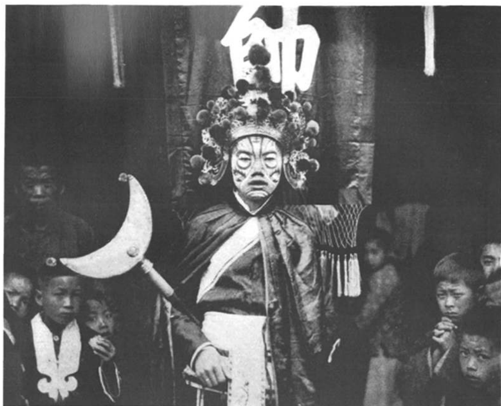
□这位站在“帅”旗前的人显然是扮演鬼魅们的首领。