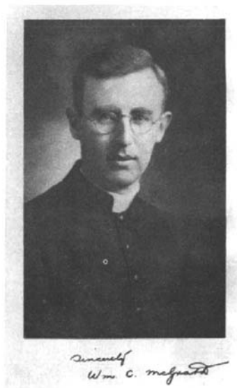
加拿大斯加尔波罗会处州监牧威廉·麦格拉斯

威廉·麦格拉斯是具有新闻记者背景，并于20世纪20年代被派遣来华的一位年轻加拿大天主教传教士。在上海接受了有关中国语言文化的专门训练之后，他被派到浙江东南部地区进行传教工作，以开辟新的教区。罗马天主教教廷在这一地区早就设有宁波代牧区。1931年，从宁波代牧区划分出了原处州府属下的丽水、青田、缙云、云和、遂昌、龙泉、松阳、庆云、景宁、宣平等十个县，设立了处州监牧区。这个新的监牧区被交给了麦格拉斯所在的加拿大斯加尔波罗会海外传教使团（The Scarboro Foreign Mission Society）管辖，除了麦格拉斯之外，还有六位其他的加拿大天主教传教士在这个监牧区内工作。1932年，麦格拉斯因传教工作出色而被任命为处州监牧区的宗座监牧（Prefect Apostolic），并在这个职位上干了整整九年。