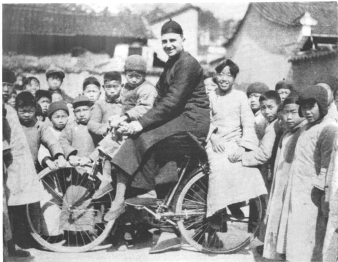
□ 加拿大天主教传教士跟丽水当地儿童们的关系相当不错。