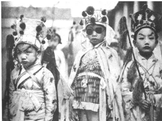
还有另外三个整装待发的小鬼

为了弄清楚丽水地区这个游神仪式的内容和性质，笔者在图书馆和互联网上查了不少资料。但遗憾的是，当时所能查到的那些中文资料中对此均语焉不详。在介绍游神这一民俗现象的文献中笔者找到了有关周王庙、城隍爷、徐偃王、禹王、三山国王、安济圣王、妈祖神，以及杨炯出游、游大神等关于民间抬着神像，在城里街头巷尾巡游的描述，但是没有一个能够与麦格拉斯上面所描述的丽水游神仪式挂得起钩来。首先，丽水游神仪式的主角是一个鬼，而不是神，这从照片上那些人的扮相中可以看出出来，而且作者也已经明白无误地告诉我们，当地人告诉他，他们所尊崇的是一个“鬼”。