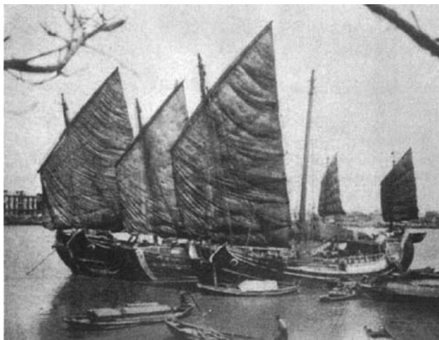
宁波地区特有的绿眉毛海船。

然而，唐宗龙所见到的丽水三月三太保庙会时间是 1950 年，离麦格拉斯所描述的那个 20 世纪 30 年代中期的温元帅巡游仪式相隔了差不多有十五年的时间，所以他所描述的庙会盛况也不能完全代表麦格拉斯所拍摄照片中那个原汁原味的温元帅巡游仪式。但无论如何，加拿大天主教传教士麦格拉斯所拍摄的老照片已经为我们提供了珍贵的图像资料。有了这些图像资料作为参考，要想恢复这一民俗活动就会变得容易多了。笔者相信唐宗龙老人向当地政府所提出的恢复丽水三月三太保庙会这一建议在不久的将来必定能够梦想成真。