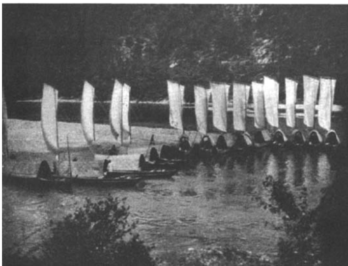
当年在瓯江上走的大多是挂着这样白帆的船。

知道这本书内容的第二天，笔者便赴美国来做访问学者了。到哈佛大学之后，马上就到图书馆找来了这本书，仔细地进行了研究。该书的题目是《鬼阵与焚船：晚清浙江地区的温元帅崇拜》， [5] 作者是一位目前在台湾中央研究院做研究员的美国汉学家康豹（Paul R. Katz）。他在普林斯顿大学做博士论文时专门研究了道教中的神仙与地方信仰中神祇之间的区别和相互影响，并以温元帅民间崇拜在浙江地区的发展历史为线索完成了他的博士论文。在其以博士论文为基础完成并出版的上述专著中，他追溯了温元帅崇拜于南宋时期在浙江的起源，以及对于产生这种民间信仰形式的各种因素，其中包括当时在浙江流行过的几次瘟疫，以及人们如何为驱除瘟疫而举行相关的宗教仪式，还对浙江南部的地方剧傩戏中关于驱除瘟疫的程式化表演形式，均作了详细的考证。而且大量引用了地方志中关于温元帅巡游的记载。笔者在书中找到了可以确认麦格拉斯所描述的丽水游神仪式为温元帅崇拜的一个重要证据。作者康豹在该书第2页的注解中明确指出，温元帅的原名为温凉，其称号是“忠靖王”。 [5]2 这正好可以跟麦格拉斯的照片相吻合，除了“帅”旗和脸谱相似之外，那些照片中还有另一面旗，上书“忠靖王”等字样。这说明上述“帅”旗即指温元帅无疑。