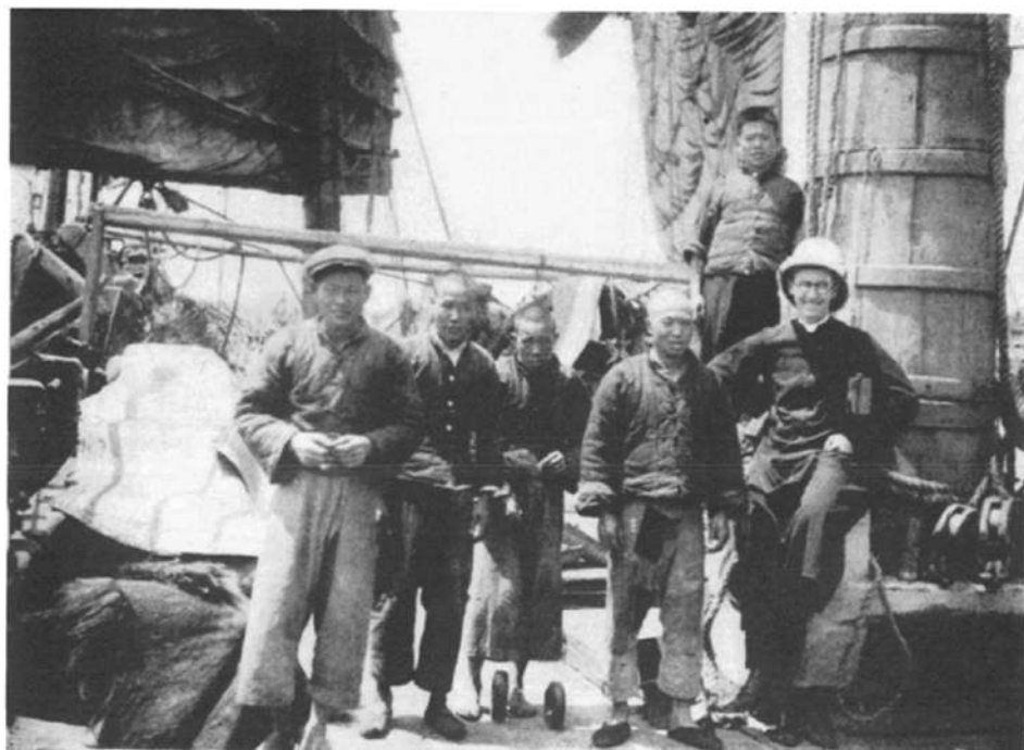
□ 丽水当地的摆渡船