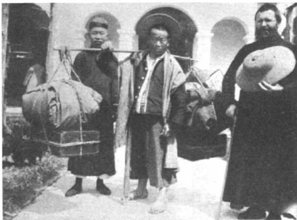
一位准备去农村传教的加拿大天主教传教士（右一）

麦格拉斯 1935 年从《中国》杂志编辑的位子上退下来时，将自己在过去几年中在丽水地区传教过程中所写的文章和拍摄的照片结集出版，名为《与龙共舞》（ The Dragon at Close Range ）。 [1] 由于作者的文笔清新，描述生动，不仅记录了加拿大传教士们在浙江处州府传播基督教福音的日常生活，而且还向西方的读者详细描述了当地的民生和民俗，并附了大量的照片作为插图，所以这本书一出版就十分畅销，1935 年 5 月出版之后立即脱销，于是该书在同年 9 月进行了第二次印刷。1937 年第三次印刷时作者对书中的内容进行了一些改编，紧接着在 1938 年 1 月又进行了第四次印刷。