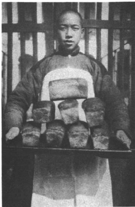
丽水这个偏僻的角落也有了洋面包。