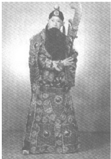
著名京剧演员马连良剧照

辛亥革命前夕，由于著名演员来汉演出的很少，京剧在武汉呈现出一度衰落的状态，几乎没有演过什么引人注目的戏。到了民国纪元（1912年），由于辛亥