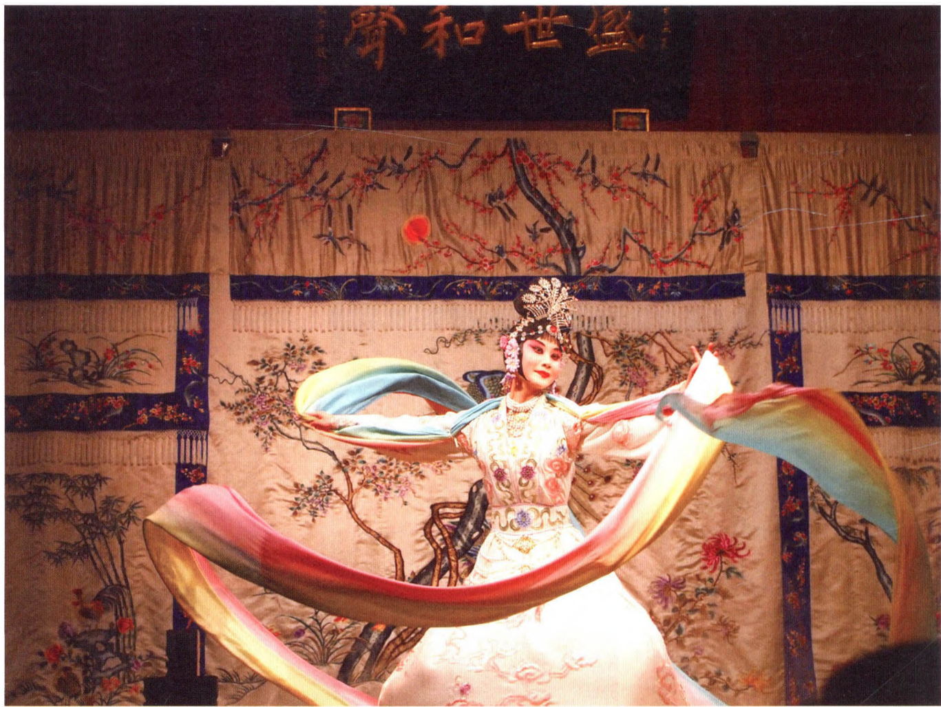
正乙祠舞台空间有限，观众与演员间更具互动感

正乙祠戏台两侧柱子上书有一副对联，曰“演悲欢离合当代岂无前代事，观抑扬褒贬座中常有剧中人。”将正乙祠的前世今生紧密相连，意味深长，也是传统戏曲艺术的真写照。