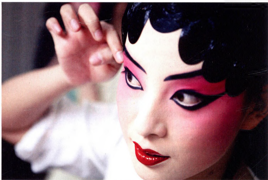
正是因为演员的精益求精,《梅兰芳华》才会受到众多票友的追捧

较小众的艺术形式,但是我们在正乙祠推出的经典剧目《梅兰芳华》却持续演出了四年,演出场次达到了300多场,这在北京、甚至全国来说都是独一无二的。”据刘欣然介绍,《梅兰芳华》是正乙祠于演出年中推出的经典京剧剧目之一,汇集了梅兰芳六出经典剧目:《抗金兵》《贵妃醉酒》《洛神》《穆桂英挂帅》《霸王别姬》《天女散花》中的著名折子,形成了一部全面反映梅派艺术的经