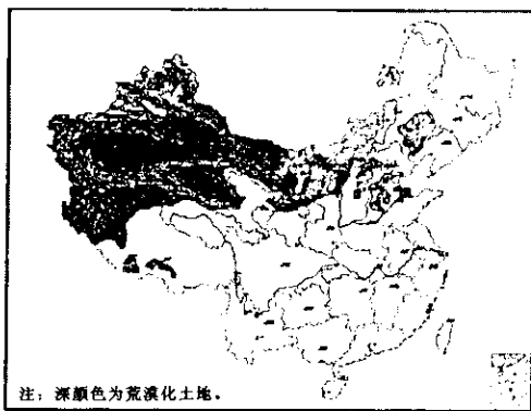
图1 中国荒漠化土地分布图

根据《联合国防治荒漠化公约》规定的指标, 中国可能发生荒漠化的范围为东经74°~119°, 北纬19°~49°, 涉及全国18个省、自治区、直辖市的471个县(市)、旗, 总面积达331.7万km 2 , 现已实际发生荒漠化的土地面积达262.2万km 2 , 占国土面积的27.3%, 主要分布于西北、华北、东北的干旱、半干旱区和亚湿润的干旱区(见图1)。