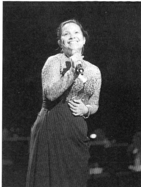
■ 文化广场开幕演出特邀音乐剧巨星莉娅·萨隆加前来助阵

首先是演唱内容的分类，导演Paul将音乐会分成了“开幕经典”、“迪斯尼舞台”、“百老汇之舞”、“百老汇传统”、“英国巨制”、“桑德汉