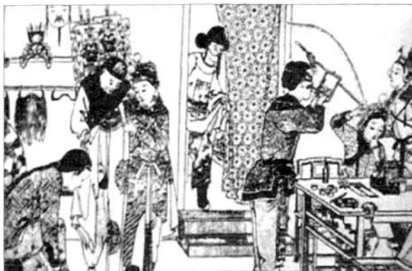
■ 民国戏园后台化妆图

清代宫廷演出活动也极繁盛，皇宫及行宫园囿中演剧场所很多，如紫禁城内的畅音阁戏台，重华宫中的漱芳斋、长春宫，圆明园中的同乐园，颐和园中的德和园、听鹂馆，热河避暑山庄中的福寿园、如意洲等，这些戏台大部分筑于庭院