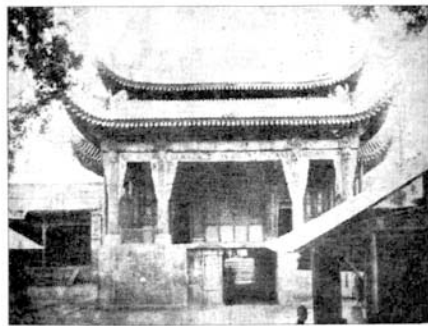
■ 西安城隍庙戏台全景

古代戏曲的演出，最初是在庙会、广场、高台进行的。到了宋代，戏曲已告成熟，出现了瓦舍（也称瓦市、瓦肆、瓦子）这样的演出戏剧、杂艺的大型游艺场。