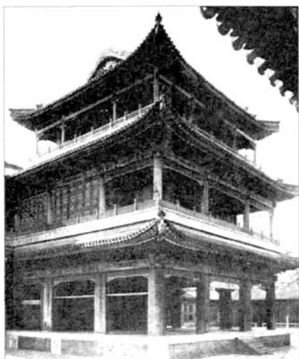
■ 颐和园中德和园戏台