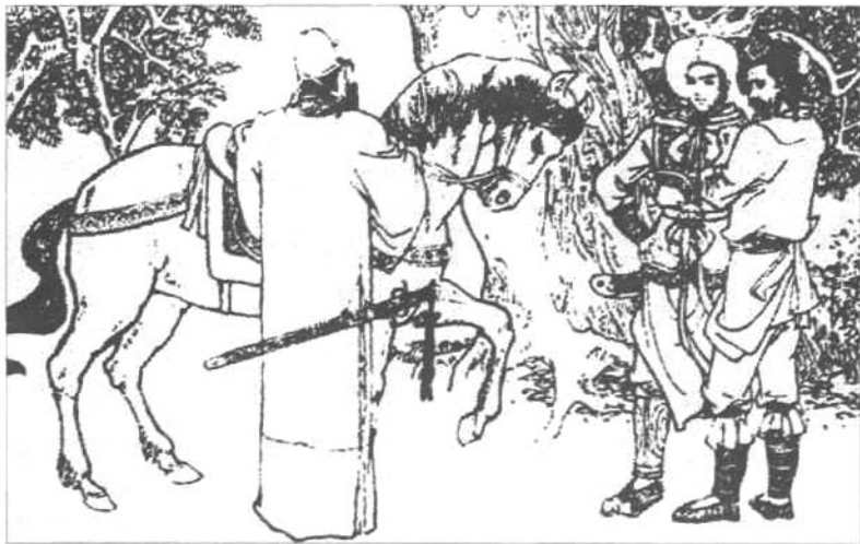
■ 那汉子，此马要多少银子？

任何艺术规律，既有其不可变的内在因素，又有着必须变化、不断创新的要求。永远墨守成规，不