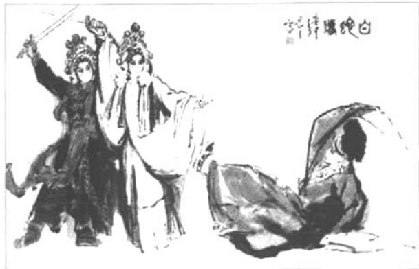
■ 《白蛇传·断桥》(董辰生绘)

原先京昆本的《断桥》，比较强调白娘子当时对许仙的怨恨：“追思此事真堪恨，不觉心儿气难伸……你缘何屡屡起狠心。哎呀，害得我几丧残生，进