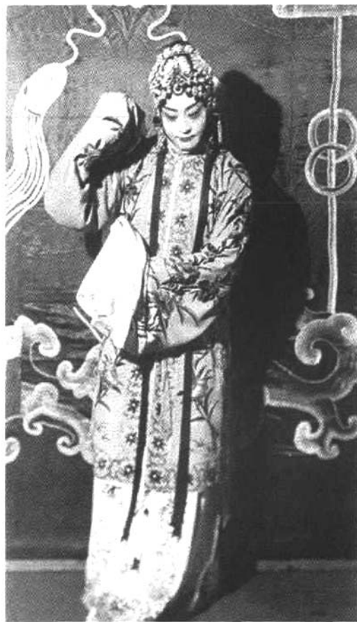
■ 程砚秋饰演的薛湘灵

失散，流落莱州，在富户卢家为仆。一日，薛湘灵偶然发现自己的锁麟囊被主人家供奉于楼上，伤怀悲啼，被主妇听见。原来卢夫人即赵守贞，得知薛湘灵乃赠囊之人后，