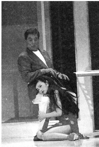
■ 从相识到相爱……是一个不可思议的过程