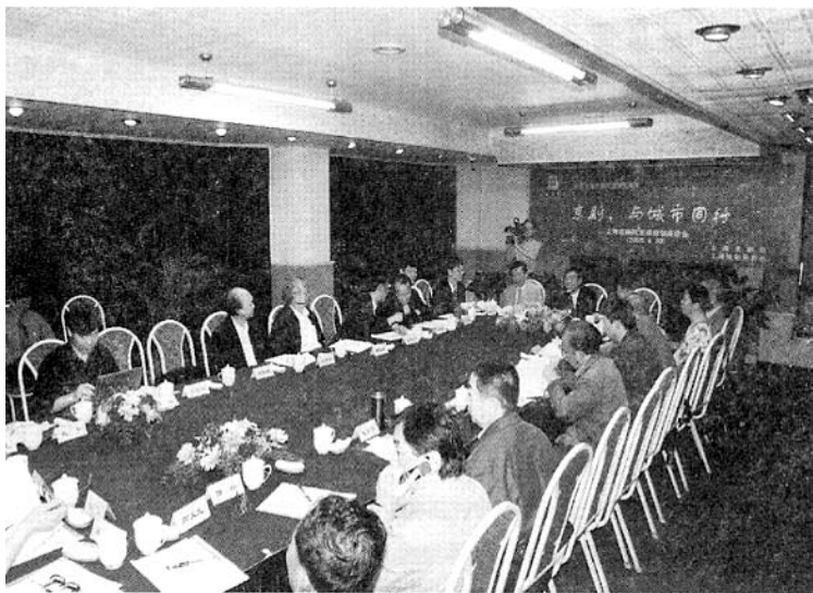
■ “京剧，与城市同行”上海京剧院发展规划座谈会

艺术的道路不会平坦。这句话，并不只对艺术家个人而言，更是对于上海京剧院这样的艺术院团而言。甘苦冷暖、荣辱休戚，构成了上海京剧院50年的跋涉之路。不过，回顾过去，是为了展望未来。此时，上海京剧人觉得，规划上海京剧艺术在新时期的发展蓝图，自然比回顾过去的辉煌历程更重要。为此，京剧院联合《上海戏剧》杂志社，邀请了京沪两地的京剧界专家、学者出谋划策，共同探讨上海京剧未来发展的走向。4月30日，以“京剧，与城市同行”为主题的上海京剧院发展规划座谈会在上海文艺活动中心举行。市文广局党委书记陈燮君，市文广局艺术总监马博敏，市文联党组书记迟志刚出席会议并讲话，市文联党组书记周渝生发来了贺信，祝贺上海京剧院建院50周年并祝座谈会圆满成功。北京京剧界专家刘厚生、龚和德、赵景勃、康式昭、傅谨，上海专家王安忆、荣广润、毛时安、赵莱静、黎中城、罗怀臻、顾晓鸣、高义龙、沈鸿鑫、郭宇、邹平、张大成等参加了会议。会上，专家们的发言表现出对京剧艺术未来发展的深入思考。大家对上海京剧50年来的成就给予了充分肯定，认为上海京剧院在各级领导的关心和社会各界的支持下，高举“麒派”艺术大旗，以“麒派”艺术精神为指导，在弘扬民族传统文化、锐意创新，剧目和人才建设方面取得了卓越的成就。同