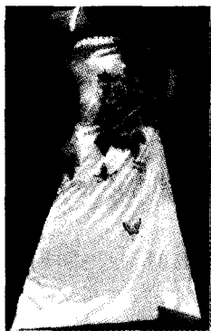
图3 图案创新的旗袍

接与人的脸型与肤色相配,领子的效果直接影响到整件服装的效果。旗袍的立领是旗袍最具代表性的一个主题元素,端庄中显现别致,高雅中映衬着娇美。同时也束缚了颈部的灵活运动,又把较粗短的颈部缺陷显露出来,为了避开这些缺点,可以将旗袍的立领做适当的变化,如图4中将立领增高至脸部,这种领型既具有立领的韵味,同时又淡化了颈的长度,使颈与脸在人的视觉上成为一体,避开了颈短的缺陷。在图5的设计中,将传统的立领改变,与现代服装的领型相结合,不再束缚颈部的活动,显得时尚,也掩盖了颈短的缺陷。在图6的设计中,将传统的旗袍与肚兜相结合,裸露