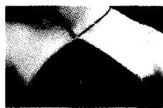
图6 传统旗袍与肚兜的结合