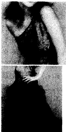
图2 个性下摆的旗袍