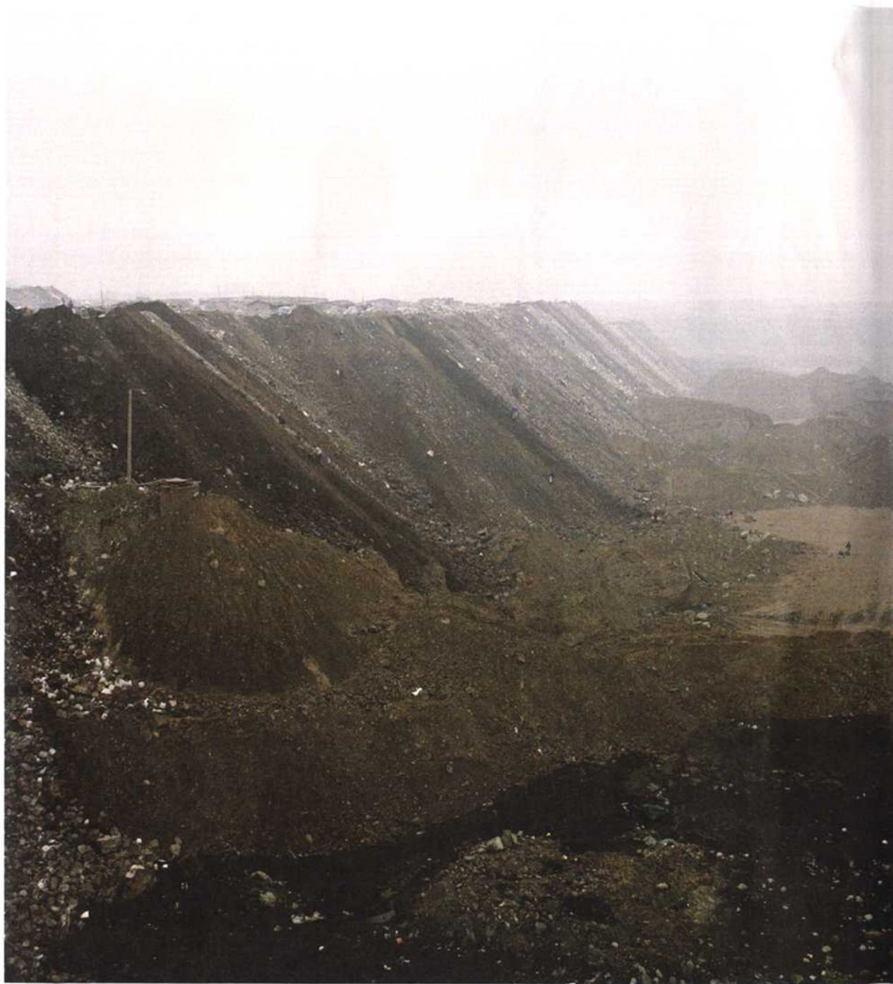
卢沟桥以北直到唐山南麓的永定河西侧，近 10 年的疯狂填埋，使这里成为北京最大的建筑垃圾消纳场