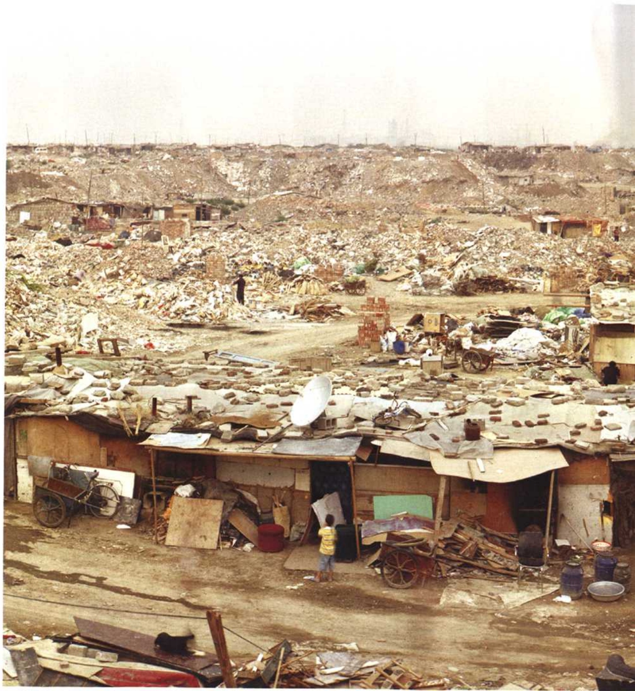
高峰时期这里聚集着 2000 多名来自四川、河南、安徽等省份的拾荒大军，他们用从垃圾中捡来的材料建设房屋，在这里生活