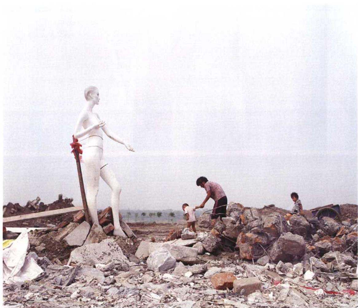
这里有苦难，但更多的，是温情