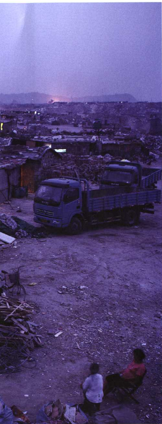
入夜，劳累了一天的拾荒者正在户外纳凉；而灯火通明处 是一户人家正在大摆筵席，庆祝又一个新生命的诞生