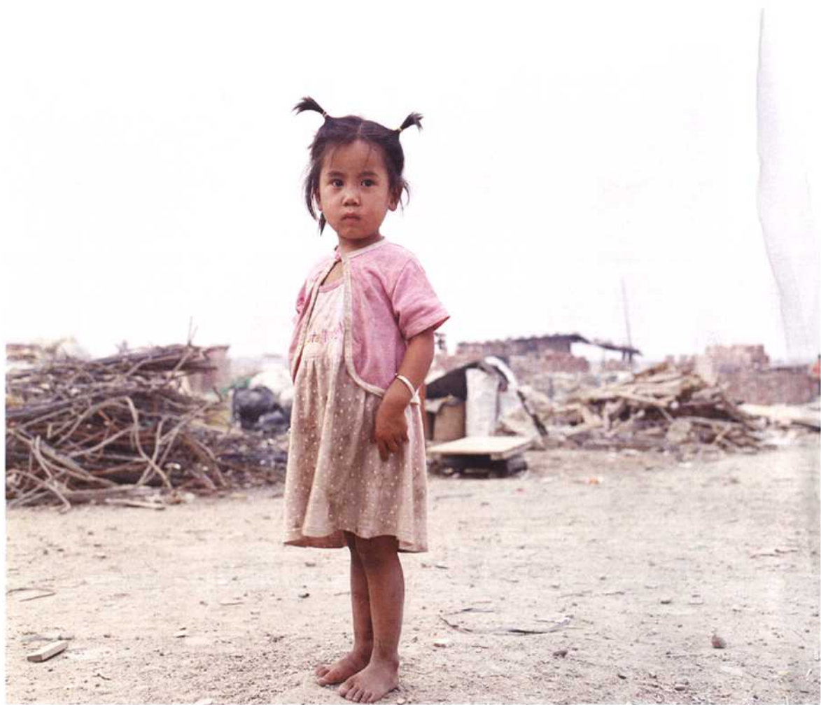
这里小于10岁的孩子几乎都是在这座垃圾场上出生的，也必将在这座垃圾场上度过他们的童年