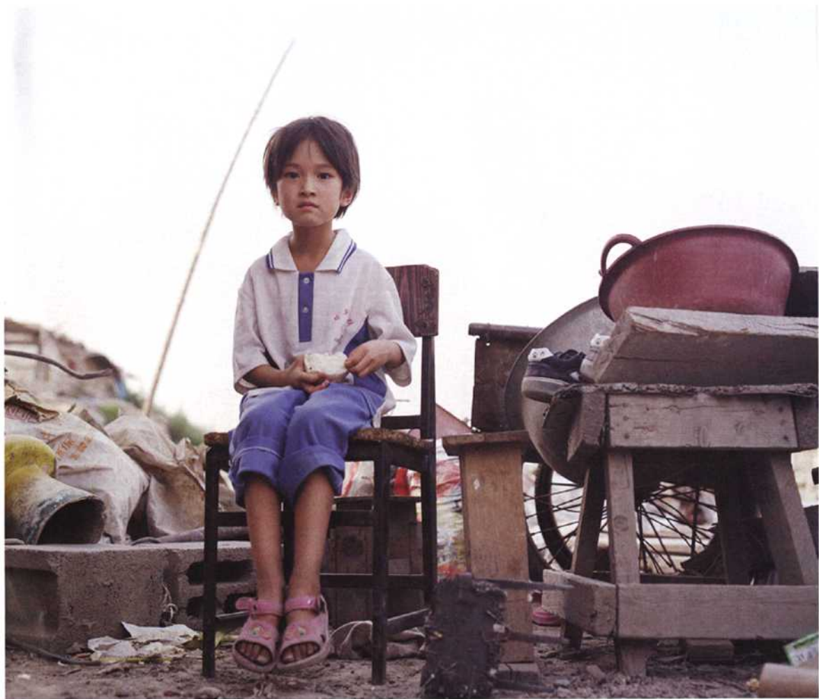
拾荒者的孩子们只能去私立的打工子弟学校上学。他们因为没有北京户口，所以在北京没有接受免费的义务教育的权利