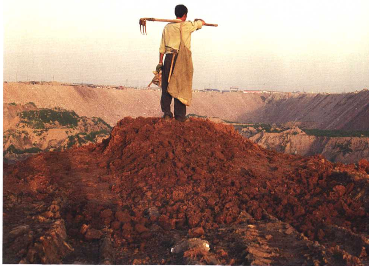
这名来自河南的拾荒者这一个下午的收获着来并不丰富