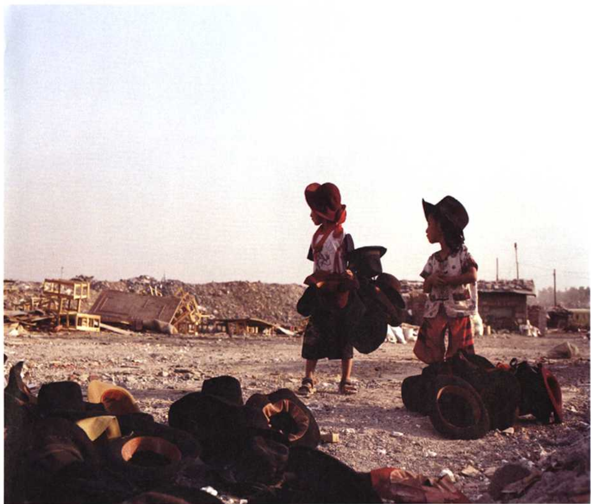
两个小男孩从垃圾场上捡到了很多的帽子。无论身处何种环境，孩子们总能找到他们自己的乐趣