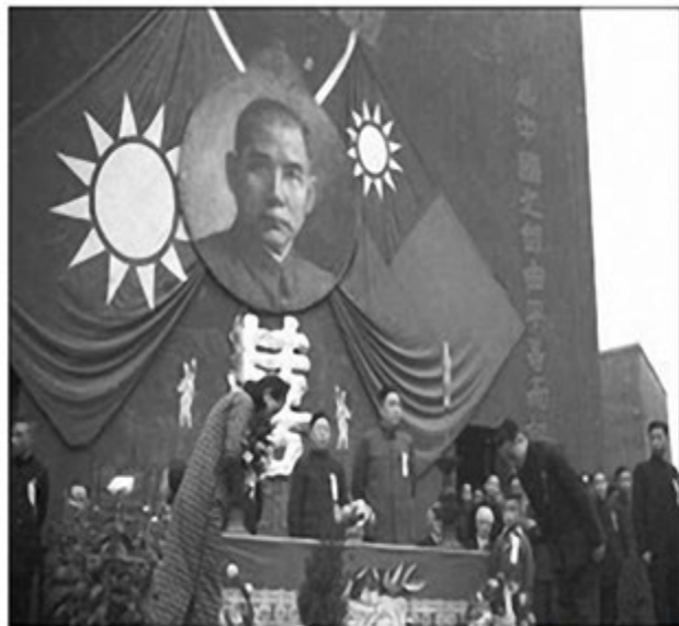
图 2:国民党政府举办的集体婚礼

色彩是最引人注目的元素,在礼服的色彩上,为了缓和突然变化引发的震动,中国传统的红色礼服颜色在文明婚礼中被柔化成了淡粉色,这种粉色娇羞可爱,配以同色的缎面鞋,新娘们一字排开,粉色在这集体婚礼中颇为壮观。白色在西方是最纯净的颜色,渐渐地人们不再忌讳婚礼上用白色,所以后来的很多礼服很快地过渡到了白色。这种简洁而不简单的颜色。有着丰富的层次,雪白、乳白、鱼白、芍药白、牙色。白色给人以纯净、祥和的感觉。结婚礼服的款式,因各个城市经济状况、接受新事物的程度不同,形成了一种多样的局面。在这个过程中,最初是袄裙的形式,后来是旗袍,渐渐的形成了旗袍和西洋礼服结合的款式,还有纯粹西式纯婚纱形式。