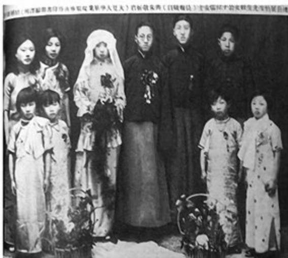
图 5: 上海新娘

图 5 这张照片是摘自 1935 年 4 月 7 日《图画晨报》, 这个上海新娘的装束虽保留了袄裙的上下分身的款式, 在袖子和上衣的下摆处, 缝制了有很多细褶的荷叶花边, 荷叶边是西方礼服中常用的一种装饰手段。上衣经过荷叶边装饰显得比一般的上衣要长, 衣身是用一色的面料, 而裙子是采用有圆点装饰的面料搭配而成。这款礼服保有传统礼服的款式, 在细节上加了些西式花边, 创意的成分更多。