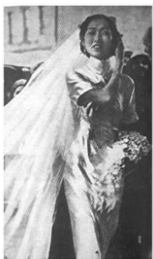
图 4: 上海新娘

图 3 是刊登于《北洋画报》1928 年 3 月 21 日的一张照片, 这位女子是哈尔滨交际家裘夫人出阁的照片。礼服是白色的, 头纱包住了新娘的额头处的头发, 从两边别住并垂下长拖至地, 新娘礼服是民国初期女子日常穿着袄裙的款式, 上下两件, 袖子是典型款式中的“倒大袖”, 这套礼服的衣身, 绣满了充满美好寓意的传统图案。除了借鉴了西式礼服的色彩和头纱装饰, 其余的部分都保留有中国传统服饰痕迹, 是一件传统风格浓重的礼服。