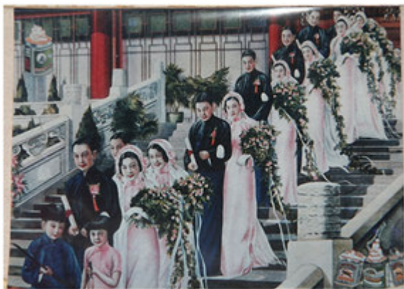
图 1:新娘穿粉红色婚礼服在文明婚礼中

婚礼是人一生中重要的场合,服装更是婚礼中的关键。作为“文明婚礼”中的新娘服饰,从民间的变化到政府的《服制条例》无不透露出结婚礼服的重要性。对于文明婚礼的礼服,政府也是有一定的要求的。1929年民国政府颁布的《服制条例》,规定男子礼服为袍、褂和中山装,女子礼服为袄裙和旗袍。于此同时政府制定了结婚办法,要先登记,再举办仪式。服饰总是具有一定的礼仪和象征功能,由此看来旗袍被作为礼服看待,说明旗袍以被正面接受并且予以明确定义。到了1935年上海市政府为响应国民党政府提倡的“新生活运动”,彻底变