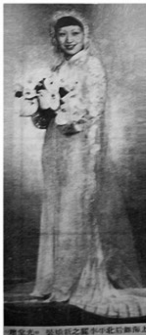
图 6: 上海舞后新娘装

图 5 这张照片是摘自 1935 年 4 月 7 日《图画晨报》, 这个上海新娘的装束虽保留了袄裙的上下分身的款式, 在袖子和上衣的下摆处, 缝制了有很多细褶的荷叶花边, 荷叶边是西方礼服中常用的一种装饰手段。上衣经过荷叶边装饰显得比一般的上衣要长, 衣身是用一色的面料, 而裙子是采用有圆点装饰的面料搭配而成。这款礼服保有传统礼服的款式, 在细节上加了些西式花边, 创意的成分更多。