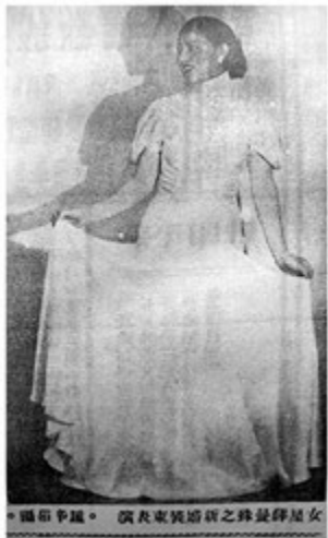
图7:天津新婚装束表演

融合了西式的鱼尾式的长裙摆，整件礼服强调了穿着者的腰部和臀部的线条，显得很妩媚。长长的拖尾使得走红地毯的新娘即神圣又美好。这件礼服已经明显的有中西礼服款式的痕迹了，且融合的不露痕迹。