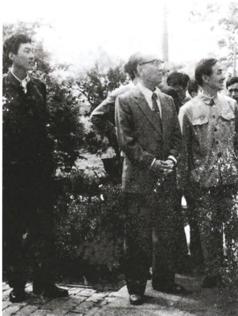
侯宝林参观盆景园

初春的北京，乍暖还寒。位于东城区东四头条19号的屋子里，春意盎然，情暖融融。时年68岁，戴着一副淡茶色眼镜，既有艺术家的洒脱飘逸，又有学者睿智儒雅的侯宝林接待了泰州市文化局工作人员。工作人员说明来意后，忐忑不安地将到泰州演出的邀请信递到他手中。原来，1979年7月侯宝林已宣布告别舞台。几年来，他除了应邀到香港、美国演出外，大多数时间都在潜心研究相声和曲艺学术，经常到北大、辽大等高