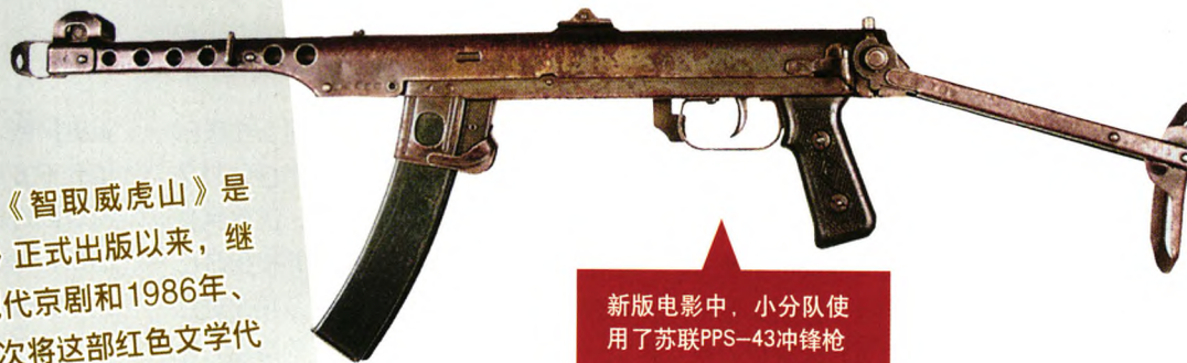
新版电影中，小分队使用了苏联PPS-43冲锋枪

徐克导演的新版3D影片《智取威虎山》是1957年长篇小说《林海雪原》正式出版以来，继1960年版电影、1970年版现代京剧和1986年、2003年两版电视剧之后，第5次将这部红色文学代表作搬上屏幕。徐大导演的名气以及颇具市场意识的策划、宣传团队，使这一段国内观众耳熟能详的老故事经过翻新包装之后，再次成为2014年贺岁档的“吸金”利器，票房直冲10亿大关。但不可否认，相对于小说原著及1960年拍摄的黑白片，3D版叙事不清、情节混乱、人物单薄、情感平淡，硬生生地把有着真实背景的经典故事拍成了靠一堆“流行元素”撑起的商业武侠片，看着鲜亮，但全无真实血肉，除了一堆勉强可称为“酷炫”的3D特效外，其亮点实在乏善可陈。该片与之前的影视剧作相比，出现的轻武器并不相同，在此，我们对片中的轻武器作一解读——