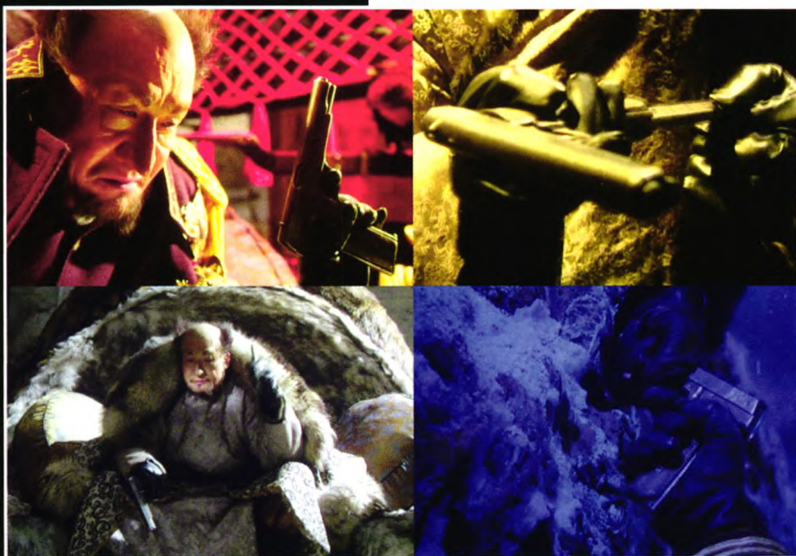
▲ 片中座山雕使用的西班牙阿斯特拉长管自动手枪