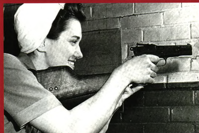
加拿大英格利斯工厂工人在对装有木制枪套的MK1手枪进行检验射击。这种兼作枪托的木制枪套也是应中方要求而增加的，和毛瑟手枪一样，通过握把背面的凹槽与枪身驳接