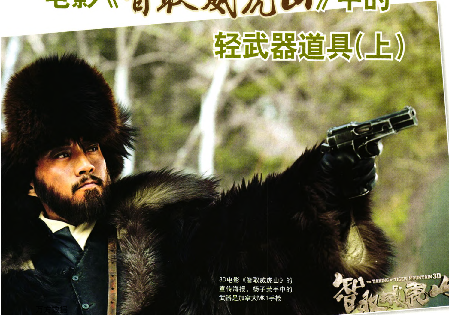
3D电影《智取威虎山》的宣传海报。杨子荣手中的武器是加拿大MK1手枪