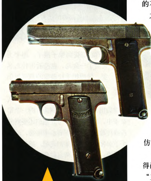
▲ 国内现存的西班牙阿斯特拉长管自动手枪（上）和皇家标准型自动手枪（下）。两者口径、结构相同，均采用长握把设计，弹匣容弹量均为10发

转行造枪，其品牌和型号多如牛毛，仅模仿勃朗宁手枪的就有近百种，最便宜的不到4美元，不及原厂产品价格六分之一。其中，7.65mm口径的手枪除了阿斯特拉外，国内常见的还有皇家、鲁比、托马斯和R.S公司的产品，6.35mm口径的手枪就更多了。这些西班牙手枪均采用自由枪机式工作原理，质量参差不齐，靠低价位抢夺国内市场，除少数做工相对精细外，大部分都称得上粗制滥造，因此在国内往往被称为“三块铁”，以形容其做工低劣，仅比国内小厂再“翻版”的仿品强一点点。