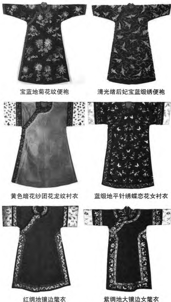
图2 满族女性日常袍服三种

服”中，除特指朝服外，一般指褂之内衣，且男女无别。 [4] 就女性袍服而言，在正式的礼服——朝袍及吉服——龙袍之外（见图1），穿着最多的是便服类。便服有三种主要形制：便袍、衬衣、氅衣。在这三种满族女性袍服中，除了共同具有的大襟右衽、盘扣、直身式的特征外，在领、袖、襟、开衩、镶滚等方面都有不同的形制区别和规定。如：便袍为小开衩，衬衣的两侧没有开衩，氅衣左右开衩至腋下。并且在使用功能和穿着方式上也有所不同，便袍是贴身穿的服饰；衬衣是可以单独穿用的便服；而氅衣是穿在衬衣、便袍外面的袍服。（见图2）