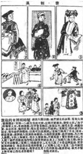
图3 钱病鹤画及注释

起源于辛亥革命，即社会与观念的革命是服装变革的先导和决定因素。从摘录 2 中清晰可知，当 1920 年“暖袍”出现之初，就有人对“旗”字冠以“袍”前的这一词组提出质疑，认为使用“旗”字有“宗社党之臭味”的嫌疑，很明显是要与清朝遗老遗少的保皇派划清界限。摘录 7 为钱病鹤的《旗袍的来历和时髦》插图的说明文字（见图 3），此段文字从另一个侧面说明：1.“辛亥”革命后，由于排满情绪，“满洲妇女因为性命关系，大都改穿汉服”，旗女袍服已成衣庄店里挂卖的“废物”，“久已无人过问”，只有戏子和妓女为出风头才偶尔仿效（可参见表 1-9）。因而，此时“旗袍”的出现不可能是旗女袍服的再兴和简单沿用，而是一种以功用为需求的新型袍服的初起。2. 是时上海妇女“大制旗袍”就给当时的人们带来了诸多疑惑和猜测，从作者的描述和插图分析中我们可以推断文中所述之“旗袍”，应该为“暖袍”或冬日所穿“长衫”，从“既美观，到冬天又可以御寒”以及“唱大鼓书所披”上看，其功用主要是御寒。并且在后文中，作者也抱着怀疑的态度表明，上海不可能有那么多穿旗人袍服的“满清遗老的眷属”。列表其余摘录条目中与“冬日”、“入冬”、“防寒”内容相关的“旗袍”，从上下文和功用的角度分析都应属于“暖袍” ③ 。暖袍作为一种时新和实用