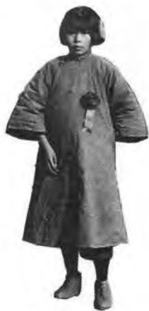
某女子师范学校高二年级师生合影（局部）传世照片 1930