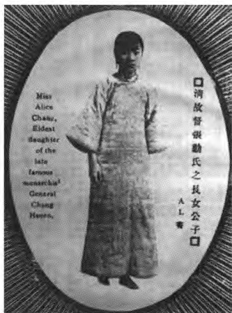
清故督张勋氏之次女《北洋画报》1927年5月21日