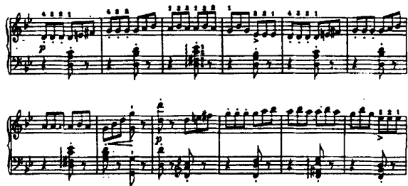
谱例3:李斯特的《塔兰台拉舞曲》

同时,李斯特在1831年听了意大利小提琴炫技大师帕格尼尼的演奏后大受启发,在键盘上推出的大量的双音阶、八度音阶、大跳和弦及刮奏等震惊当时欧洲钢琴界的高难度演奏技巧。其实斯卡拉蒂早在巴洛克时代,就在古钢琴上进行了同样的尝试与创作,最大限度地发挥了古钢琴的演奏性能,尽可能发掘古钢琴所能表现出来的各种音响。这在巴洛克时代是有着极其深远的历史意义和现实意义的。