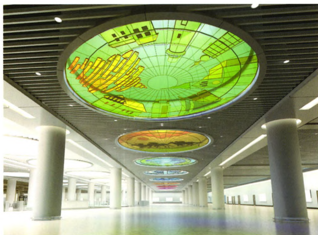
臧雪 美丽海岸 玻璃镶嵌 直径400厘米