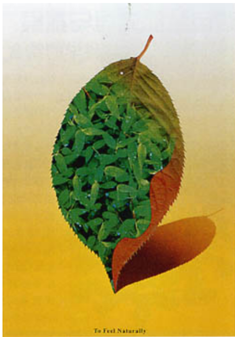
To Feel Naturally